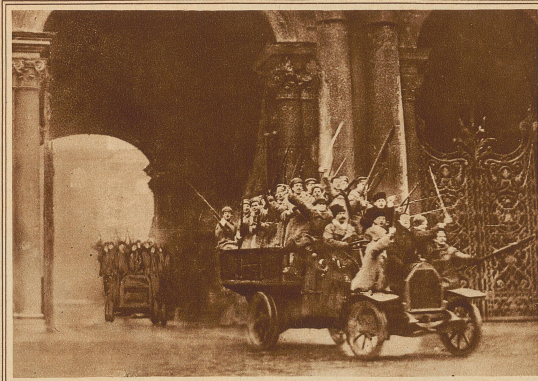
Die theatrale Wiederholung der Revolution: Erstürmung des Winterpalais; Automobile mit revolutionären Truppen passieren das Tor