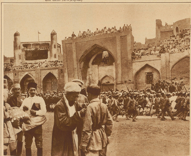
Der Vorsitzende des Exekutiv-Komitees von Bucharra dekoriert die Helden der Roten Armee mit Kriegsauszeichnungen