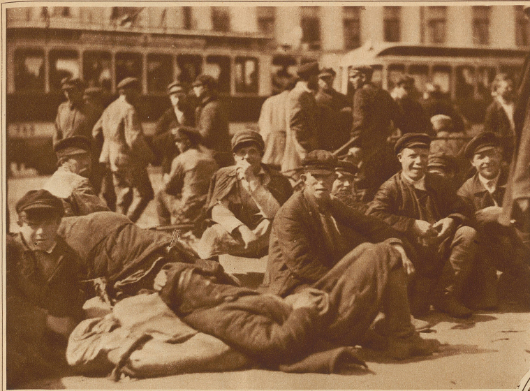
Arbeitslose warten vor dem Gebäude der Moskauer Arbeitsbörse auf Arbeit