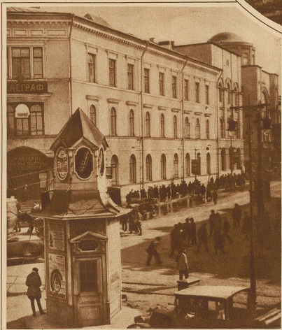
Das Hauptpostgebäude an der Miasnitskajastraße in Moskau