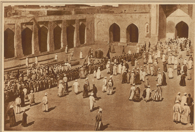
Ein festlicher Aufzug vor der Kalian-Medresse in Bucharra