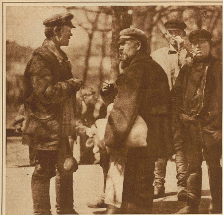
Moskauer Fabrikarbeiter während der Mittagspause