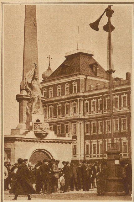
Auf allen belebten Plätzen Moskaus sind Lautsprecher aufgestellt, durch welche dem Publikum die Tagesneuigkeiten übermittelt werden. Unser Bild zeigt den Lautsprecher vor dem Revolutionsdenkmal auf dem Sowjetplatz