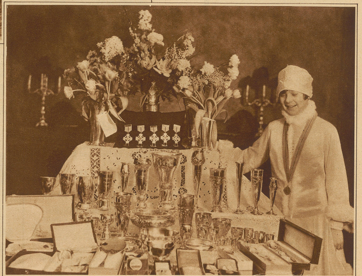
Sonja Henie, Oslo, die erst 15 jährige Weltmeisterin im Eiskunstlaufen, mit ihren wertvollen Preisen