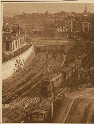
Unterführungsbauten beim neuen Bahnhof Wiedikon, der als Reiterbahnhof über die Geleiseanlagen gebaut wurde