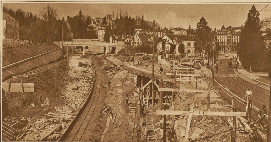
Die Arbeiten für die Anlage der neuen Station Enge. Rechts die Seestraße, längs welcher einige Häuser niedergelegt werden mußten, um Platz für den Neubau zu schaffen. Links hinten die Ueberführung der Bederstraße, dahinter der neue Ulmerstunnel nach der Station Wiedikon