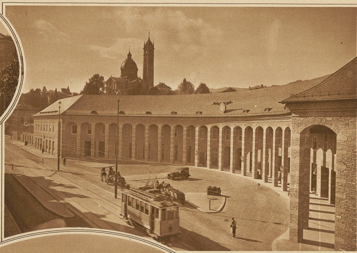
Die 160 Meter lange Fassade an der Seestraße mit den vorgelagerten Arkaden