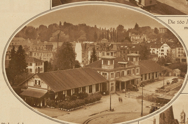
Blick auf das alte, dem Abbruch geweihte Aufnahmegebäude Zürich-Enge