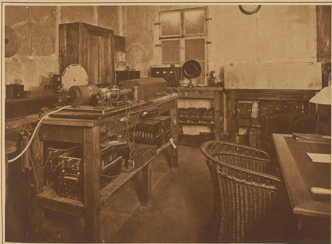
Blick in den Bildersenderaum der Station Nauen