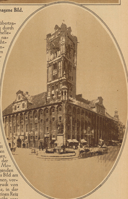
Radiobild nach dem System Prof. Korn auf der Deutschen Photographischen Ausstellung im August letzten Jahres aufgenommen. Die Übertragungszeit dauerte 5 Minuten