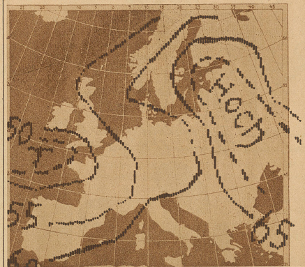
Eine Wetterkarte, wie sie täglich vom Münchner Sender gefunkt wird. Die Bildwirkung wird durch senkrechte Schraffuren erreicht

steigender Größe des letzteren wächst also erst recht die Trägerfrequenz, was nichts anderes besagt, als daß die anzuwendenden Wellenlängen immer kürzer werden. Für die riesigen Modulationsfrequenzen sind deshalb nur die sogen. «Kurzen Wellen» (unter 100 m) zu benötigen. Ohne Zweifel ist aber das Problem des technischen Fernsehens lösbar, und die Television wird vielleicht schon bald von der heute lebenden Menschheit bestaunt werden.