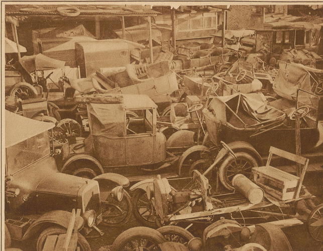
Ein Autofriedhof im Norden Londons. Autos, die für weitere Dienste zu alt oder bei Unfällen betriebsunfähig geworden sind, werden hier gesammelt. Die noch brauchbaren Teile werden abmontiert und der Rest vernichtet