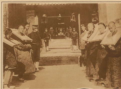
Die chinesischen Gefangenen werden teilweise heute noch mit mittelalterlichen Strafwerkzeugen behandelt. So zeigt unser Bild, wie den Leuten ein hölzernes Gestell von beträchtlichem Gewicht um den Hals gelegt wird, das sie Tag und Nacht mit sich herumerschleppen müssen

Die neueste Modetorheit, die übrigens diesmal nicht aus Amerika oder Paris, sondern aus Wien stammt, ist die Bemalung der Haare in einer zum Abendkleid passenden Farbe. Aber nicht nur zum Kleidepassend, sondern auch noch dem Charakter des Festes entsprechend, kann sich die Dame ihre Haare anstreichen lassen