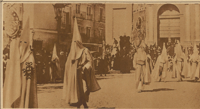
Mittelalterliche religiöse Gebräuche in Spanien. Malerische Prozessionen verummter Mönche durchziehen die Straßen der spanischen Städte