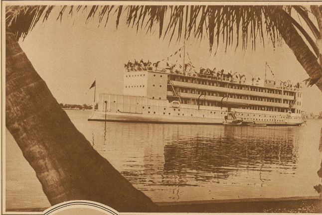
Das schwimmende Hotel ist wohl die idealste Wohnung für unstete Naturen. Als erstes großes Unternehmen dieser Art wurde kürzlich die «Amphitrite» eröffnet, die in der Gegend von Miami stationiert werden soll