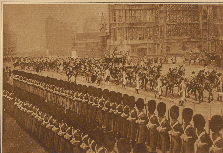
Die Staatskutsche mit dem englischen Königspaar in den Straßen von London auf dem Wege zum Parlament, dessen Eröffnung mit großem Pomp gefeiert wird

Der deutsche Außenminister Stresemann in eifrigem Gespräch mit einem Journalisten in San Remo, wo er gegenwärtig zur Kur weil