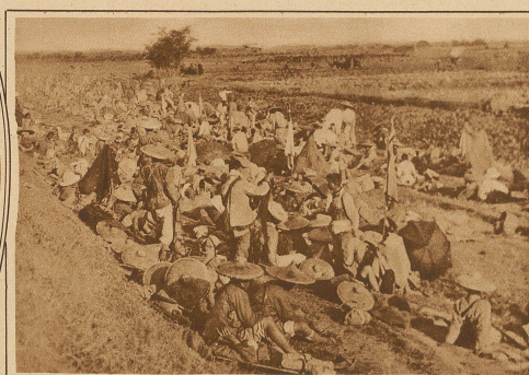
Soldaten der Kanton-Armee während einer Gefechtspause hinter der Front