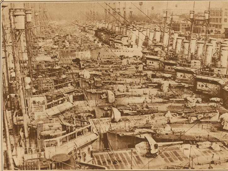
Zu den Ereignissen in Zentralamerika. Die lange Flucht von Schlachtschiffen der im Hafen liegenden amerikanischen Kriegsflotte. Einige Einheiten sind bekanntlich nach Nicaragua und Mexiko und nun neuerdings auch nach Schanghai beordert worden