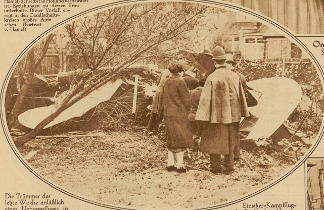
Die Trümmer des letzten Wechs anlässlich eines Übungsfluges in einen Hausgarten abgestürzt