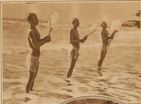
In der Meeresbrandung stehende Nichtironen (Angehörige einer buddhistischen Sekte) schlagen zu ihren Bittgebeten für das Seelenheil des Kaisers ihre eigenartige Trommel