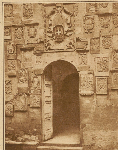
Eine eigenartige Fassadenverzierung befindet sich am Rathaus von Arezzo (Italien), das im Jahre 1332 erbaut wurde. Jeder, der das Bürgermeisteramt inne hatte, ließ über od. neben dem Eingang sein Wappen anbringen