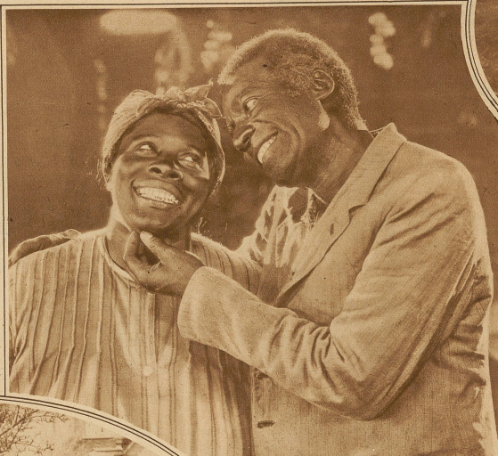
Onkel Toms Hütte im Film. Unser Bild zeigt die Szene in den glücklichen Tagen vor Onkel Toms Verkauf, mit Lowe und Gertrude Howard als Onkel Tom und Tante Chloe