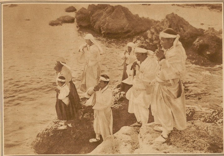
Mitglieder der Shinto-Sekte beten an der Küste von Hayama, gegenüber dem Kaiserpalast, für den verstorbenen Herrscher DIE ERSTEN BILDER VON DER JAPANISCHEN LANDESTRAUER FÜR DEN VERSTORBENEN MIKADO