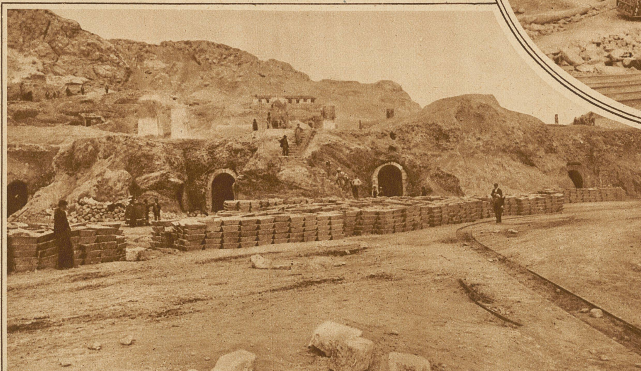
Vor den Schmelzöfen aufgestapelter, versandbereiter Schwefel

Bis vor etwa 100 Jahren war die ganze europäische Industrie für den Schwefelbedarf von Si-