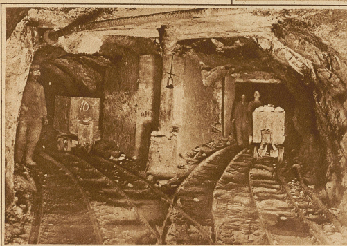
Soweit Förderkarren vorhanden sind, müssen sie in den Stollen durch einzelne Arbeiter geschoben werden

Bis vor etwa 100 Jahren war die ganze europäische Industrie für den Schwefelbedarf von Si-