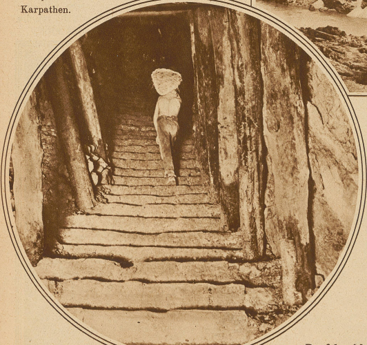
Eine ebenfalls noch stark vertretene Förderart: