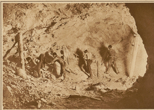
Vorbereitungen für eine Sprengung

Schwefel zutage gefördert werden, die einen Wert von rund 25 Millionen Goldlire repräsentieren. Das Hauptlager befindet sich an der sogenannten Bergkette der Madonie; es zieht sich über den größten Teil der Insel bis nach Trapani einerseits und Cattagirone, Ramocca und Centuripe nach der andern Inselseite hin und stellt so ein Gesamtgebiet von zirka 170 km Länge und 80 km Breite dar. Diese unermesslichen Vorräte sind buchstäblich unerschöpflich, besonders für die Italiener. Warum denn gerade für die Italiener? Aus dem einfachen Grunde, weil Italien die Schwefelausbeutung noch immer mit ganz primitiven, veralteten Hilfsmitteln betreibt. Man stelle sich nur einmal vor, daß der gebrochene Schwefel stellenweise