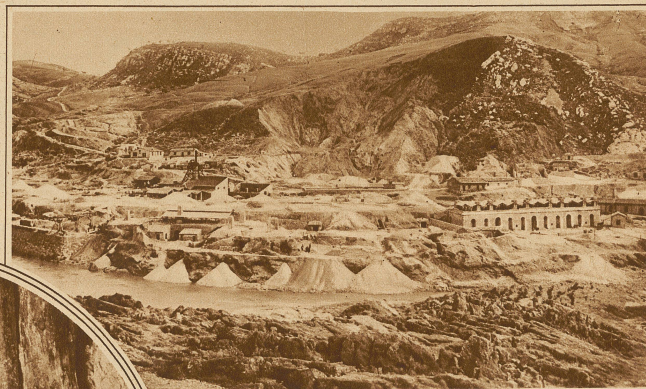
Gesamtansicht der Schwefelmine Tallarita

Die bedeutendsten Schwefellager Europas sind diejenigen in der Molasse Siziliens, vor allem in der Provinz Caltanissetta. Ferner gibt es in Frankreich bedeutende Vorräte in den Ablagerungen des Braunkohlenbeckens der Basses Alpes bei Biabaux und in Südspanien in der Sierra Gador bei Almeria. Amerika besitzt Schwefel in Utah, Nevada, Louisiana; Japan verfügt über erhebliche Solfatare mit Tellur. Auch in der Romagna bei Civitavecchia ist Schwefel zu finden, ferner in Kroatien bei Radobay und in den Karpathen.