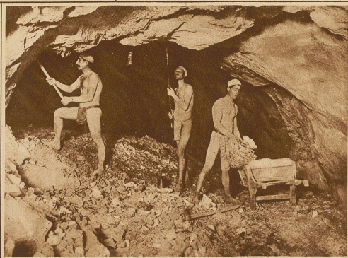
Losschlagen des Schwefels in den unterirdischen Gängen. Die Leute arbeiten vielfach ohne jegliche Bekleidung

Obschon sich die Schwefellager nicht tief unter der Erde befinden, müssen sie doch durch Stollenbau gehoben werden. Der Schwefel wird unmittelbar an den