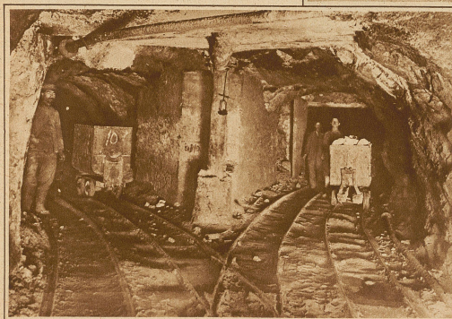
Soweit Förderkarren vorhanden sind, müssen sie in den Stollen durch einzelne Arbeiter geschoben werden

Im Zusammenhang mit diesen Darlegungen veröffentlichen wir einige interessante Bilder aus den Schwefelbergwerken Siziliens, die dem Leser zugleich einen Begriff von der dortigen mittelalterlichen Ausbeutungsmethode geben.