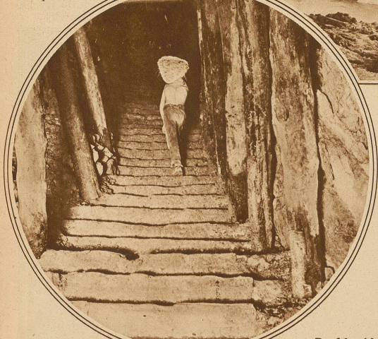
Eine ebenfalls noch stark vertretene Förderart: