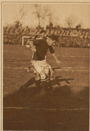
Kampf um den Ball