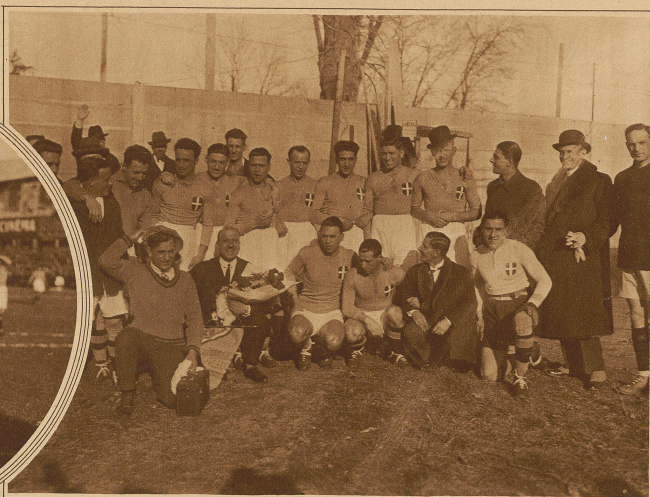
Die siegreiche Mannschaft Italiens