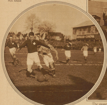
Kampfmoment vor dem Tor der Schweizer