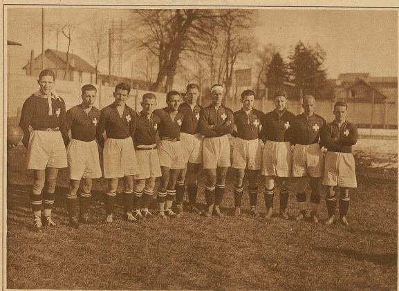
Die schweizerische Nationalmannschaft