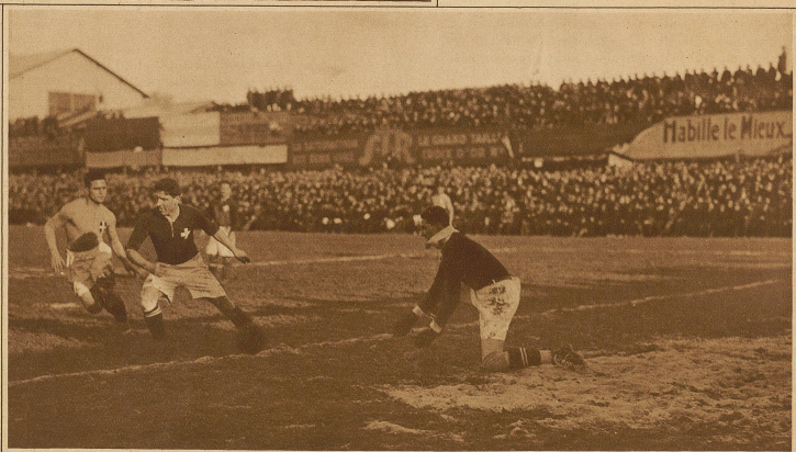
Kritische Situation vor dem Schweizerertor