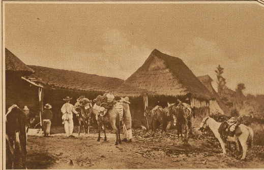
Beladen der Lasttiere

Die zweite Nacht verbrachten wir zum er-