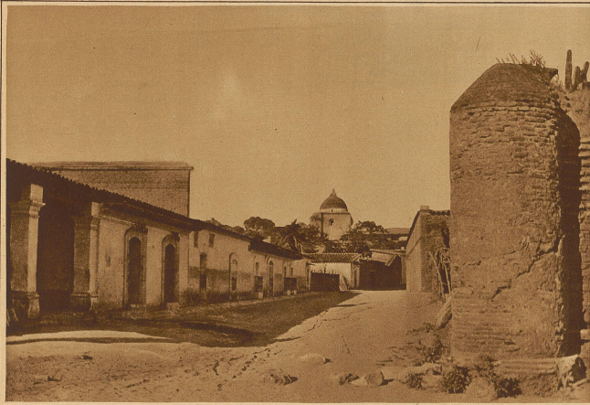
Eine Dorfstraße in Mihahuatlán

schlanken Kokosnußpalme. Einen besonders malerischen Hintergrund bilden die vielen verschiedenartigen Farnkräuter, von der kleinen, in Europa einheimischen Pflanze, bis zu einem über den Kopf von Pferd und Reiter emporwachsenden Strauch. Das Ganze durchkreuzt und durchquert ein Wirrwarr von Schlingpflanzen, von den Aesten und Stämmen der Bäume, bis auf den Grund hinunterhängend, oder von Busch zu Busch sich ausbreitend.