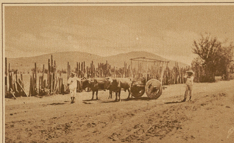
Auf dem Wege nach Mitla: ein typischer Ochsenkarren

stenmal auf unseren Feldbetten, in der Hütte einer gastfreundlichen Alten. Die «mozos» (Diener) schliefen im offenen Korridor auf Kisten und «petates» (Strohmatte) liegend, wie es die Art der Indianer ist. Betten sind ihnen unbekannt und wenn sie etwa in den Häusern der Städte den Dienstleuten geboten werden, so ziehen sie in den meisten Fällen den harten Boden den weichen Matratzen vor.