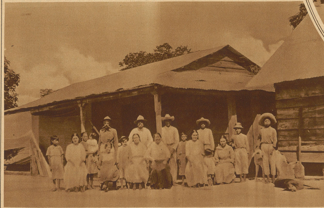
Die recht zahlreiche Familie eines mexikanischen Pflanzers

Um die Mittagszeit überraschte uns ein schwerer Regenguß. Da hatten wir Gelegenheit, wahrzunehmen, daß die großen mexikanischen Hütten nicht nur zum Schutze gegen die grellen, heißen Sonnenstrahlen, und der breite, außen umgekrempte Rand zum Aufbewahren von Zigaretten, Streichhölzern und allerlei Edwaren vortrefflich dient, sondern noch auf andere Weise nützlichst verwendet werden kann. Als es zu regnen begann, entkleidete sich unser unermüdliche Führer vollständig, packte seine «sieben Sachen» in den hohen Guß seines Hutes, den er sich wieder aufsetzte, erfreute sich eines erfrischenden Ba-