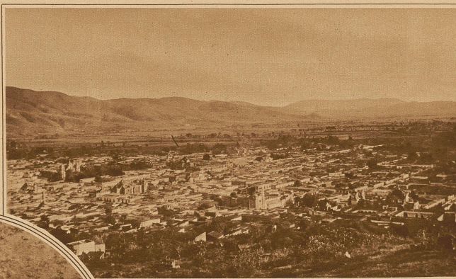
Gesamtansicht der Stadt Oaxaca

Der Weg zwischen Ejutla und Mihahuatlán, unserem nächsten