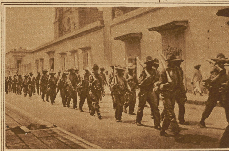
Der Einzug von Regierungstruppen in Oaxaca