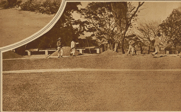
Der Kaffee wird mehrere Tage auf ausgedehnten Zementböden ausgebreitet, bis er von der Sonne völlig ausgetrocknet ist

Ein wunderschöner Anblick bot sich unserem Auge, als die Kaffeebäumchen in vollster Blüte standen. Wie leichter, frisch gefallener Schnee hoben sich die weißen Blumen von den dunkelgrünen Blättern ab, einen angenehmen Geruch ausströmend.