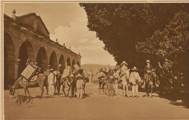
Die Karawane unseres Mitarbeiters beim Verlassen des Dorfes Ejutla