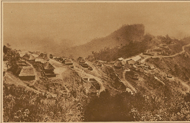
Das reizende, am Berghang gelegene Dörfchen San Pedro