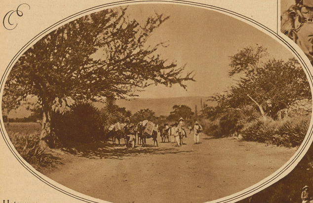
Unterwegs von Ejutla nach Mihahuatlán

schlanken Kokosnußpalme. Einen besonders malerischen Hintergrund bilden die vielen verschiedenartigen Farnkräuter, von der kleinen, in Europa einheimischen Pflanze, bis zu einem über den Kopf von Pferd und Reiter emporwachsenden Strauch. Das Ganze durchkreuzt und durchquert ein Wirrwarr von Schlingpflanzen, von den Aesten und Stämmen der Bäume, bis auf den Grund hinunterhängend, oder von Busch zu Busch sich ausbreitend.