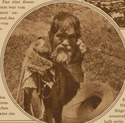
Bettlertypus am Wagenfenster des Eisenbahnzuges

Darin wurde den in größeren Ortschaften des Staates sta-