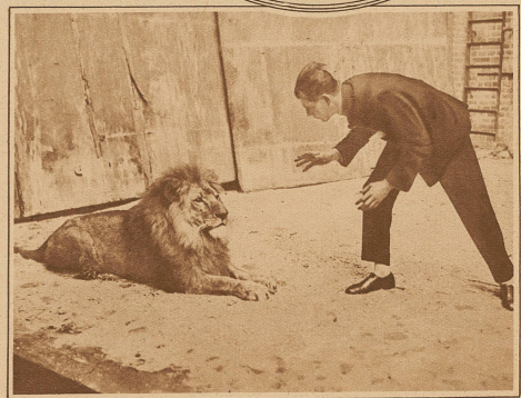
Labéro, der durch seine Tierhypnose ein weltbekannter Artist wurde, ist bei einer Vorführung im Zirkus Busch in Breslau von einem Löwen angefallen und schwer verletzt worden