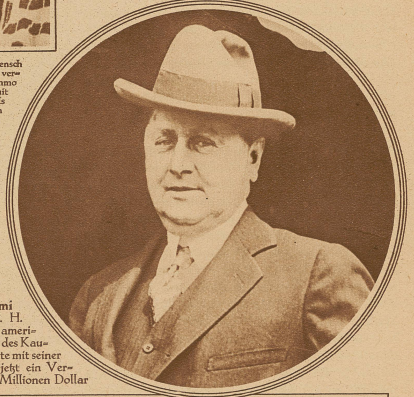
Bild rechts: der Mann, der die Welt mit Kaugummi beglückte. P. H. Wrigley, der amerikan. Fabrikant des Kaugummi, verdiente mit seiner Erfindung bis jetzt ein Vermögen von 35 Millionen Dollar