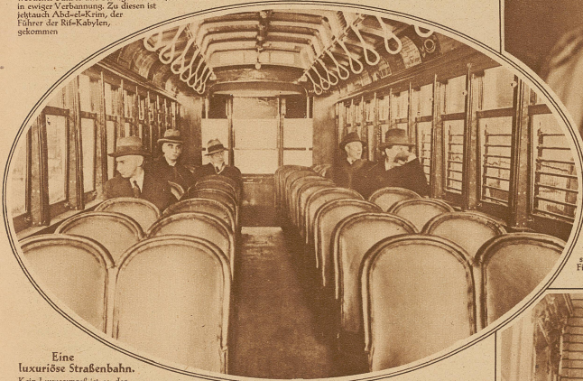
Eine luxuriöse Straßenbahn. Kein Luxuspreis ist es, der diese bequemen Kissenpolster besitzt, sondern eine ganz gewöhnliche Straßenbahn, die bloß lokalen Zwecken dient und in New Jersey in Dienst genommen wurde