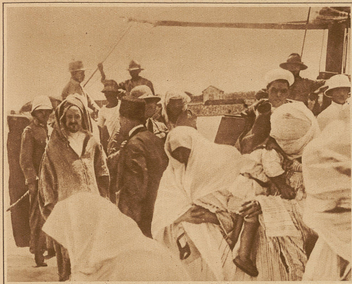
Abd-el-Krim im Exil. Auf einer Insel, die ein tropisches Paradies ist, leben eine Anzahl in Frankreich unliebsam gewordener Führer und Könige der französischen Kolonien in ewiger Verbannung. Zu diesen ist jetzt auch Abd-el-Krim, der Führer der Rif-Kabylien, gekommen