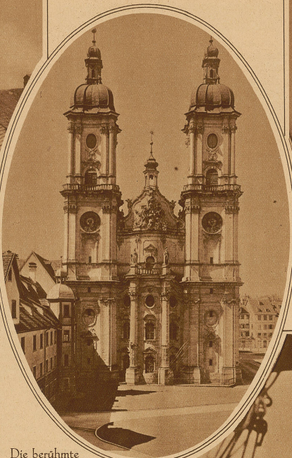
Die berühmte Kathedrale von St. Gallen erfährt dieses Jahr eine Außenrenovation