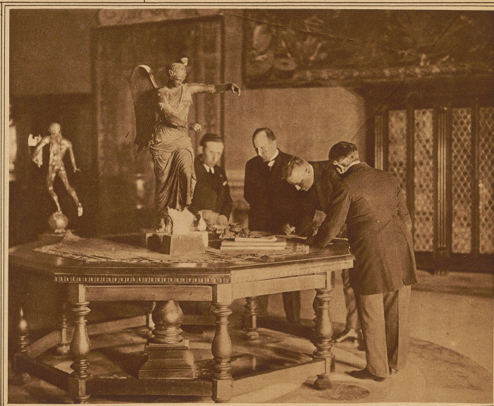
Die Unterzeichner des deutsch-italienischen Vertrages