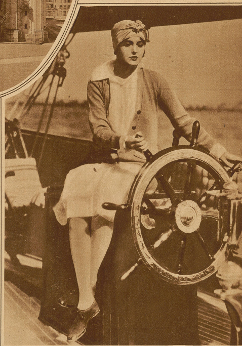
Eine Corinne Griffith am Steuer ihrer Jacht. Eine der beliebtesten amerikanischen Schauspielerinnen, die Gattin des weltbekannten Regisseurs und Schauspielers Griffith, ist mit ihrer Jacht nach San Pedro gefahren