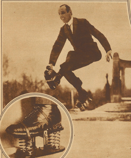
„Siebenmeilentiefel“, ein neues Spiel- und Sportgerät. Das Bild zeigt den Erfinder bei der praktischen Vorführung