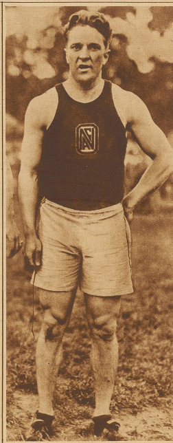
LOREN MURCHISON, der erfolgreiche amerikan. Kurzstrecke-läufer, ist an den Folgen einer Blutvergiftung gestorben. Murchison bestritt seinerzeit auch den Endlauf über 100 m anlässlich der Pariser Olympiade