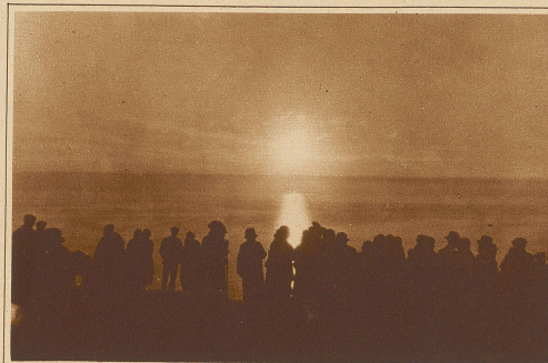
Mitternachtssonne, 12 Uhr nachts, am Nordkap

Abenden des hohen Nordens singen sie ihre endlosen Weisen, aus denen die wehmütige Größe der sie umgebenden Natur spricht — einer Natur, die in ihrer Armut doch so überaus schön ist! Da ist zur Linken das weite nordische Eismeer in seiner stillatmenden Ruhe, zur Rechten aber in weiter Ferne, hinter den mit Zwergbirken bestandenen Weiden, ragen jähe Schneeberge schemenhaft in dem flammenden Himmel, über den die «Corona borealis» sich wie ein Drache dahinwindet, zuckt und brennt und erlischt, während die Schneeberge in violette und rosa Dämmerung sinken — die Schneeberge, nach denen den Lappen alljährlich ein neues, starkes Sehnen treibt, sobald im Juni die Tauwässer von den Bergen zu strömen beginnen... Da zieht er mit dem ganzen Stamme zu den Hängen hinan, die sich — auf kurze Wochen nur — rasch mit dem bunten Blumenflor des hohen Nordens bedecken, und da vergiftet er im glückseligen Weideleben, daß er zu einem armseligen Volke gehört, welches in wenigen Jahrzehnten vom Erdboden verschwunden sein wird.