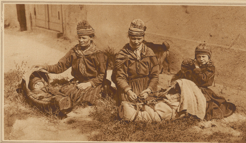
Lappländerfrauen mit ihren Kindern in den eigenartigen Wiegen

Von den in Norwegen noch lebenden 17000 Lappen sind heutigen Tages der zehnte Teil Nomaden, denen nach einem Grenzgesetz gestattet ist, im Winter über die Grenze nach Schweden zu ziehen, ebenso wie es den schwedischen Lappen erlaubt ist, den Winter auf Norwegens Feldern zu verbringen. Der Norweger nennt den Lappen «Finn», der Lappe aber bezeichnet sich selbst als «Samelader», d. h. Sumpfbewohner. Noch vor wenigen Jahrzehnten gab es zwischen den ständigen Bewohnern