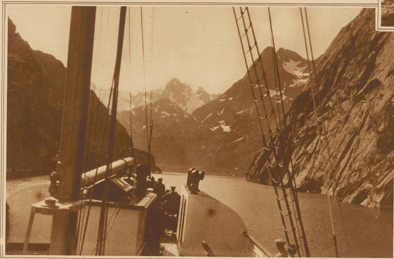
Fahrt durch den Troldfjord in Norwegen

(den Fischern und Seeleuten) und den Lappen häufig Streit und Schlägereien. Mehr und mehr ist da eine Mischung zwischen beiden Elementen eingetreten, bei denen das germanische Element verlor, das lappische aber gewann. So ist der Typus vieler Lappen bereits fast germanisch, ihre Neigung zum Zeltleben geschwächt.