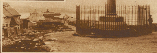
Die Meridiansäule bei Hammerfest

er sich auf diese Weise warm zu halten. Unerträglich trüb und dumpfig erscheint dem Kulturmenschen dieses Wohnen! In allen Hütten findet sich große Unsauberkeit, deren gesundheitsschädliche Wirkungen freilich durch den häufigen Aufenthalt in freier Luft ausge-