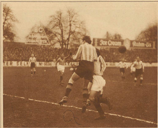
Zürichs Verteidigung bei der Abwehr