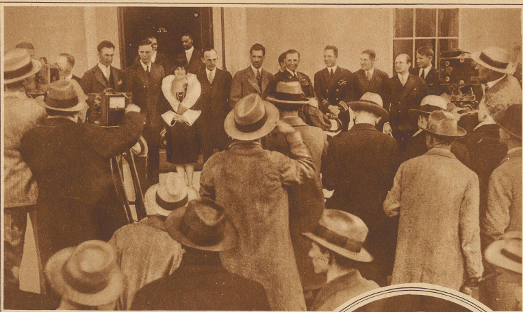
Präsident Coolidge empfing alle amerikanischen Ozeanflieger im Weißen Haus. Man bemerkt auf der Aufnahme u. a. Lindbergh, Byrd, Chamberlin, Ruth Elders und Levine