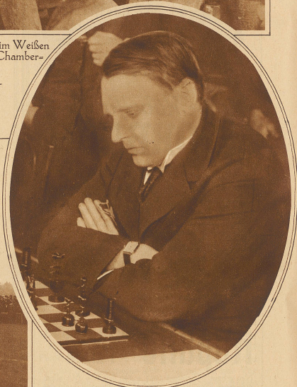
Alicin, der neue Schachweltmeister. Er schlägt den Exweltmeister Capablanca mit 6-3 Gewinnpartien bei 35 Remisen