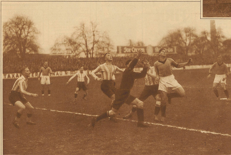
Aller Segen kommt von oben . . . Eine hohe Flanke vor das Tor des F. C. Z.