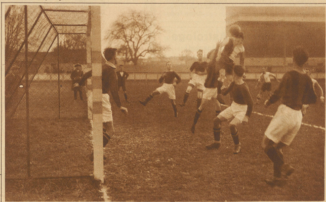
Grahoppers - Chiasso 9:0 Ein Eckball gegen die Tessiner