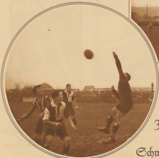
Aaraus Torwart faustet