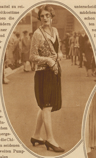
Der Damensmoking des Jahres 1928

unterscheiden; ebenso gehen die Tiroler Bauernmädchen und teilweise auch unsere Walliserinnen schon seit altersher ihren ländlichen Arbeiten in Hosentracht nach. In Europa herrscht noch immer der Rock, und die «Unausprechlichen» sind vorläufig nur beim Sport erlaubt. Aber wenn die Vermännlichung der Frau weitere Fortschritte macht — wer weiß — vielleicht folgen nach Herrenschneid, Umlegekragen und Krawatte bald — die Hosen.