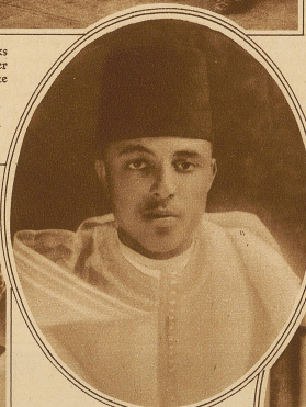
Der neue Sultan von Marokko, der erst 16 jährige Si Mohammed Hamada