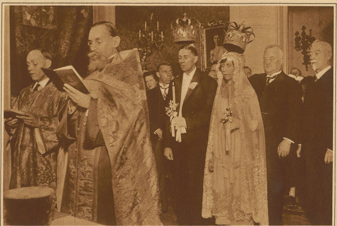
Am Montag fand in Bonn, trotz Protest aus Doorn, die vielbesprochene Hochzeit der Prinzessin Viktoria, einer Schwester des Exkaisers Wilhelm, mit dem 30 Jahre jüngeren Russen Alexander Zubkow statt. Die Kronen haben dabei natürlich nicht fehlen dürfen.