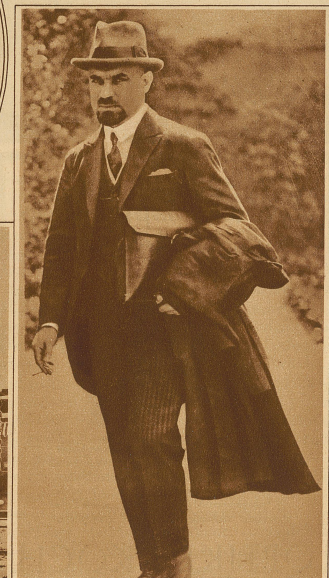
Joffe, der ehemalige Sowjetgesandte in Berlin, hat sich in Moskau erschossen.