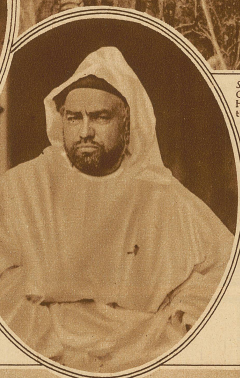
Mulay Jussuf, der vorige Woche verstorbene Sultan von Marokko