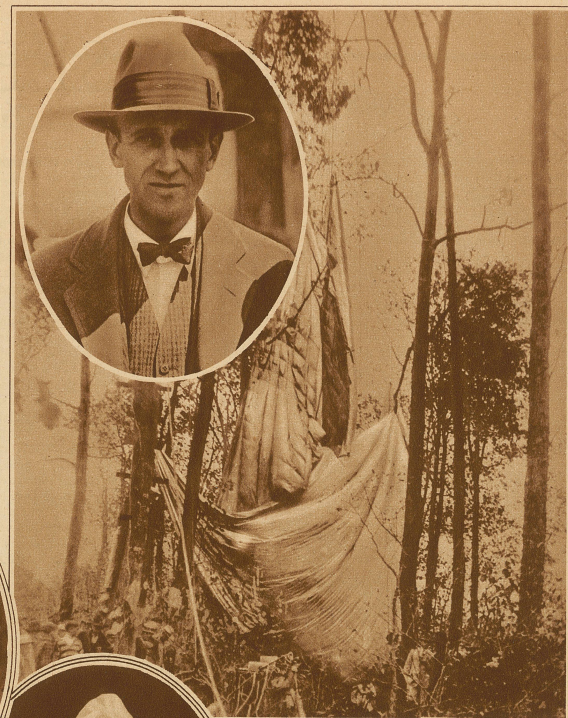
Seinen Weltrekord mit dem Tode bezahlt. Der amerikanische Ballonführer Cpt. Gray hat zum Zwecke wissenschaftlicher Forschungen mit seinem Ballon einen Höhenrekordling unternommen. In der bis jetzt von keinem Menschen erreichten Höhe von 14000 Meter versagte der mitgeführte Sauerstoffapparat, so daß Gray erstikte. Die im Bilde ersichtlichen Trümmer des Ballons wurden in einem Walde bei Sparta (Tennessee) gefunden.