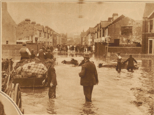
Das Hochwasser, das vorige Woche England heimsuchte, hat auch in Wales große Verheerungen angerichtet, wo ganze Dörfer unter Wasser gesetzt wurden. Das Bild zeigt eine Szene aus Cardiff.