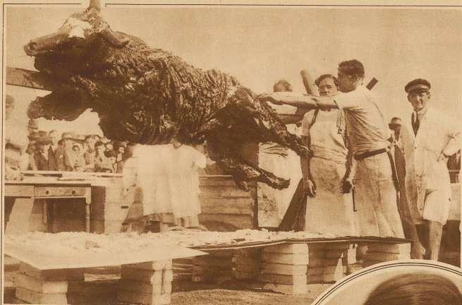
Einer der interessantesten ungarischen Volksbräuche ist das aus der Heidenzeit stammende öffentliche Braten eines ganzen Ochsens. Während aber früher der Ochs von irgendeinem reichen Stiften zur Verfügung gestellt, und die Bratenstücke verschenkt wurden, haben sich heute die Metzger der Sache bemächtigt und verkaufen die Bissen um gutes Geld.