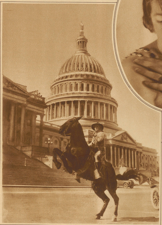
Eine mutige Amazone ist die bekannte amerikanische Schönheit Miß Vonciel Viking, die auf Grund einer Wette für 25000 Dollar einen Distanzritt von New York nach Los Angeles ausführt. Das Bild zeigt Miß Viking vor dem Capitol in Washington.