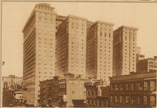
Das größte Hotel der Welt, das Hotel Pennsylvania in New York, ist eröffnet worden. Die 2200 Zimmer weisen allen erdenklichen Komfort auf.