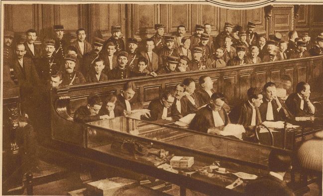
Vor dem Pariser Schwurgericht hat letzte Woche ein Monsterprozeß gegen eine polnische Banditenbande von 19 Köpfen begonnen. Nicht weniger als 6 Morde, 4 Totschlagsversuche und 68 Einbrüche werden ihr zur Last gelegt. Die Aufnahme zeigt einen Blick auf die Angeklagtenbank.