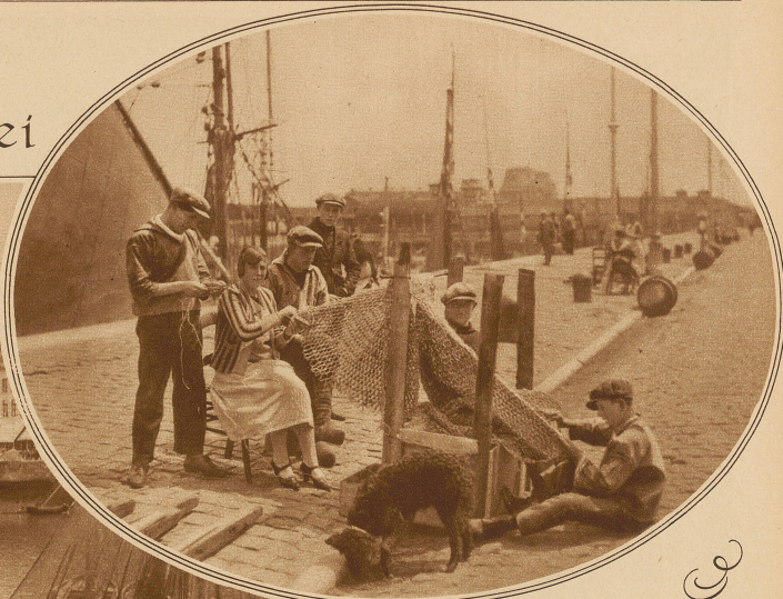
Fischerfamilie beim Netgeknüpfen