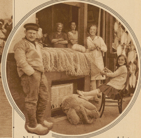
Nach der Fischerfamilie vor ihrem Heim am Hafen von Ostende