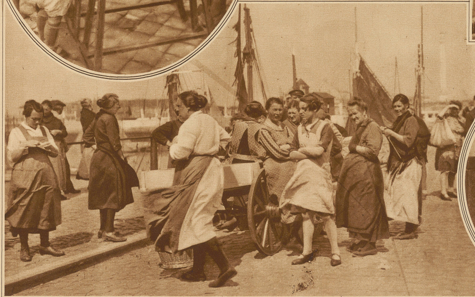
Die Frauen erwarten die Heimkehr der Crevettenfischer, um die frischen Krabben in Empfang zu nehmen