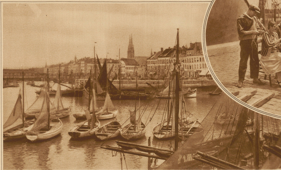
Die Flotte der Crevettenfischer im Hafen von Ostende

Unteres Bild: Straßen- verkauf von Krabben und