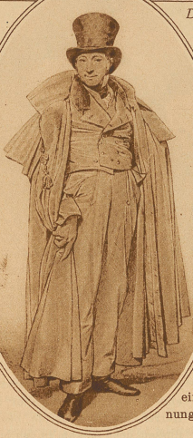
Monsieur Leblanc + Mode 1823

eines Tages auch der Herr wiederum in reichen Gewändern einherstolzieren wird, ein Pfau, der sich mit bunten Federn schmückt.