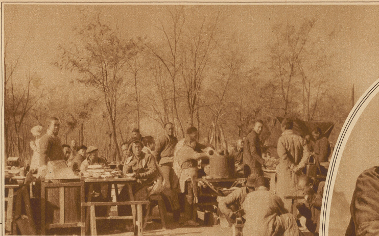
Eine Gartenwirtschaft in Peking

Nachdem nun einmal in der Zeit zwischen 500—1000 unserer Zeitrechnung der chinesische Schönheitskodex erklärt hatte, die Zierlichkeit eines weiblichen Fußes hänge lediglich von seiner Kürze ab, da wußten die Chinesinnen der ersten Stände nichts eiligeres zu tun, als darüber nachzusinnen, wie sich