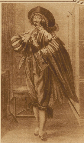
Edelmann um 1650