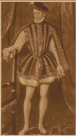
Karl IX. von Frankreich

schlitz, so daß aus dem feinsten Tuch ein Wust von Sammet oder Seide quoll und die Gestalt der ehrwürdigen Männer zu unförmigen, wandelnden Kleiderständern machte. Daß sich allerdings auch die Frauenkleider in derselben Zeit durch eine Stoffverschwendung ohnegleichen auszeichneten, soll nicht ungesagt bleiben. / Den größten Pomp entfalteten Herren und Damen im Rokoko, und wenn auch die Frauentracht schon anfängt, reicher zu sein als die der Männer, so sind die Herren der Schöpfung doch noch durch große Pracht ausgezeichnet. Seidenstoffe, mit Pelz und Sammet geziert, in zartesten Tönungen, werden noch durch die reichen, weichfallenden Jabots gehoben; zierliches Spitzengriesel rinnt von den Händen herab und gibt ihnen etwas Weibisches. Die Westen werden mit Goldfäden gestickt oder aus kostbaren Brokatstoffen hergestellt, ja, sogar ein orientalischer Einschlag ist oft bei der Männerkleidung zu finden, bei der der Turban diese Geschmackrichtung betont. Gegen all diesen Luxus macht sich eine gesunde Reaktion bemerkbar, die namentlich in der Zeit der großen Kriege um 1800 spürbar wird. Aber sie ist doch nicht groß genug, um die Freude an Farbenpracht und Luxus zu verdrängen, und schon in den ersten Jahrzehnten nach den Befreiungskriegen finden wir bei den Herren abermals das Bestreben, sich reich und phantastisch zu kleiden, wenn auch die