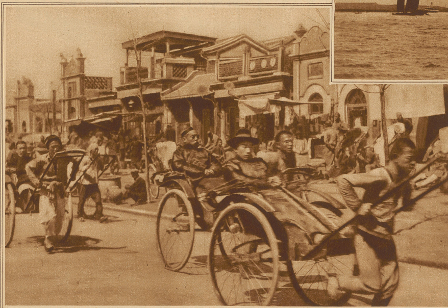
Straßenbild aus Peking

Aber man braucht nur um einige kurze Jahrzehnte zurückzugehen, um zu sehen, daß auch die Männer der Farbenfreudigkeit huldigten und daß sie alles liebten, was absonderlich war. Man denke an den Gent des Biedermeier mit den engen grauen Beinkleidern, der buntseidenen Weste und dem blauen, grünen, roten oder violetten Frack, und man erkennt sofort, daß auch die Männer weit davon entfernt sind, Gleichförmigkeit ihrer Kleidung als das Ideal zu betrachten. Wollte man boshaft sein, so könnte man wohl behaupten, auch das Pfauenmännchen suche durch bunte Farben den Blick des Weibchens auf sich zu