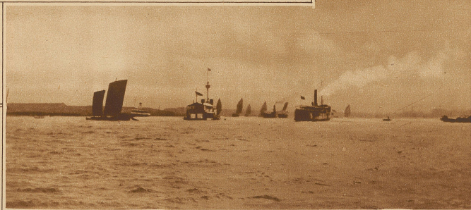
Schiffsverkehr auf dem Whangpoo. Im Hintergrund liegt Schanghai