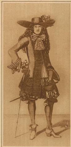
Habit d'épée zur Zeit Ludwigs XIV.

ziehen, und vielleicht mache es der Herr nicht anders als sein Geschlechtsgenosse im Tierreich. Aber selbst, wenn man diesen hässlichen Vergleich scheut, statt dessen aber ein wenig im Buche der Mode blättert, dann findet man immer wieder: auch der Herr hat eine Hinnigung zum Luxus und liebt es, sich herauszuputzen, oft noch mehr als die Frauen, die ja als das «schönere Geschlecht» das Vorrecht haben sollten, auf ihre Kleidung großen, ja sogar den allergrößten Wert zu legen. / Alle die vielen Uebertreibungen, in denen sich die Mode gefällt, wiegen nicht so schwer wie die Tatsache, daß sich erst in den letzten fünfzig Jahren eine Vereinfachung der Herrenkleidung durchgesetzt hat, die vielleicht auch nur einen Uebergang bedeutet. Kleiderverordnungen des Mittelalters beweisen den Ueberfluß, der in vielen Kreisen, namentlich des wohlhabenden Bürgertums, herrschte, und wenn auch die Frauen kostbare Spitzen, edles Pelzwerk, schöne Stickereien liebten, die Männer machten es nicht anders, ja, ihnen galten sogar in erster Linie die strengen Verbote, die die Stadt- und Staatsoberhäupter erließen und die sich gegen jede Verschwendung an Stoff und Zierat richtete. Die Pluderhosen mit ihrem ungeheuren Stoffverbrauch waren zum Teil noch mit Pelz verbrämt oder ge-