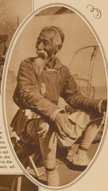
Typus eines nordchinesischen Straßenhändlers

Der nur 15 cm lange Krüppelfuß einer Chinesin