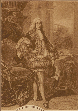
Der Herzog von Gersers im Staatsgewand (1735)