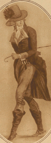
Vormittagsanzug um 1780

eines Tages auch der Herr wiederum in reichen Gewändern einherstolzieren wird, ein Pfau, der sich mit bunten Federn schmückt.