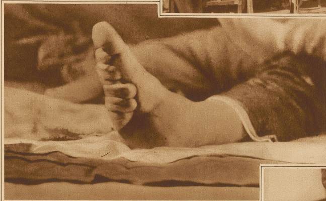
Die am meisten gepflegte Art der Fußverkrüppelung: Die vier kleinsten Zehen werden unter die Fußsohle gebunden

wärtsbewegen konnten, sondern stets von Dienerinnen gestützt werden mußten. Eine Besserung kam erst in neuerer Zeit. Missionäre und aufgeklärte Chinesen traten gegen Ende der Mandschu-Dynastie, d. h. in den letzten fünfzig Jahren gegen diese Unsitte auf, und ihre Bemühungen waren besonders in den letzten fünfzehn Jahren so erfolgreich, daß man heute in den Städten kaum noch Mädchen mit verkümmerten Füßen sieht und auch in den mehr ländlichen Gegenden kommt man von dieser Unsitte, die ein Jahrtausend gedauert, all-