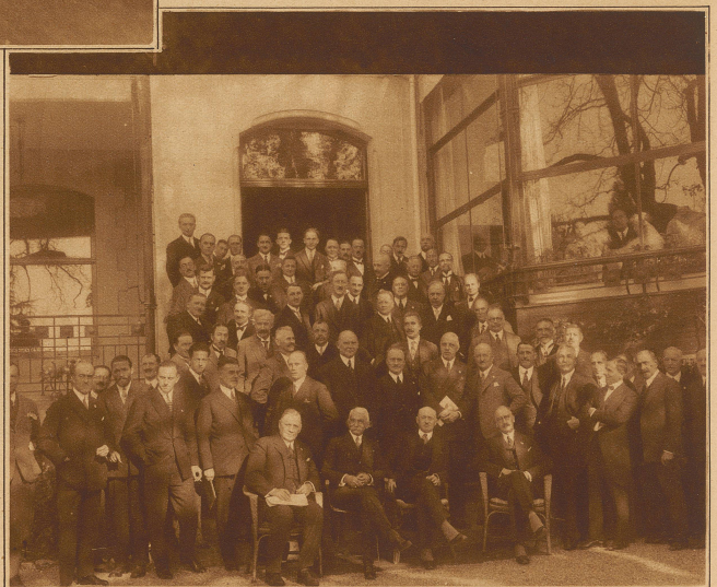
Schweizerisches Olympisches Komitee und Exekutivkomitee der II. Olymp. Winterspiele in Lausanne