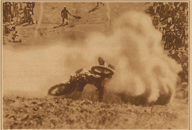
Nichts für schwache Nerven. Gefährlicher Sturz beim 9. Jahresbergrennen in Oakland (Kalifornien) wo eine besonders schlimme Stelle, ein Abhang mit darauffolgender Anhöhe, nur von wenigen Fahrern ohne Sturz passiert werden konnte