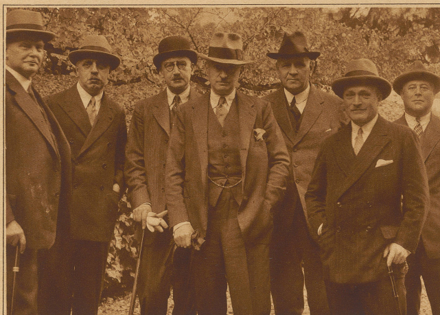
Internationales Olympisches Komitee