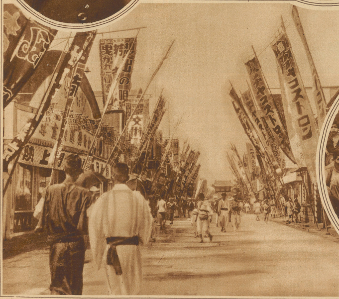
Japans Straßen des Vergnügens. Eine Straße von Tokio, an welcher sich beinahe nur Kinos und Teehäuser befinden, die mit ihren originellen Reklameschildern zum Besuche einladen