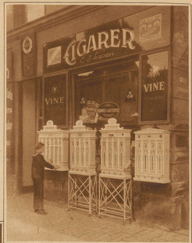
Bild rechts: Der Automat als Verkäufer nach Ladenschluß. In Kopenhagen kommt kein Raucher mehr in Verlegenheit. Die meisten Zigarrenhändler haben sich nämlich eine ganze Anzahl Automaten angeschafft, die während der ganzen Nacht u. den Sonntag über die hauptsächlichsten Sorten Zigarren und Zigaretten abgeben