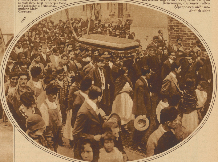
Zu den Unruhen