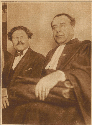
Samuel Schwarzbard, der Mörder Petljuras, des früheren Hetmans der Ukraine, vor den Assisen der Stadt Paris, die ihn freigesprochen haben. Schwarzbard behauptet, die Tat aus politischen Motiven begangen zu haben, da Petljura der Urheber der Judenpogrome gewesen sei