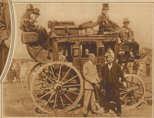
Bevor das Auto erfunden wurde, besaß auch der Automobilkönig Henry Ford eine Reisekutsche, die er jetzt als Antiquität auf der Eisenbahn-Ausstellung in Baltimore ausgestellt hat. Henry Ford steht vor dem Reisewagen, der unsern alten Alpenposten nicht unähnlich sieht