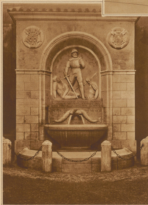
Das von Bildhauer Eduard Zimmermann geschaffene Denkmal im Hof der Kaserne der Schweizergarde