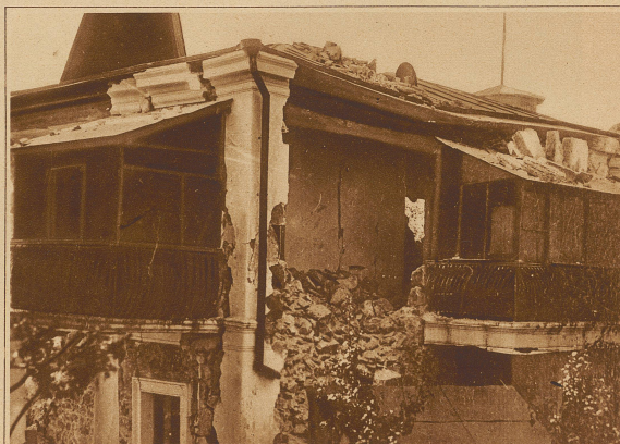
Das zerstörte Erholungsheim für Wissenschaftler in Aluschtsa

Die Nordküste des Schwarzen Meeres war 14 Tage lang in Aufruhr; Tag für Tag erfolgten größere und kleinere Erdstöße, die in vielen Ortschaften zerstörend wirkten