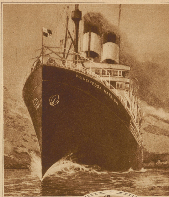
Der versunkene 12 000-Tonnen-Dampfer «Principessa Mafalda»

Zwischen Bahia und Rio de Janeiro ist der am 11. Oktober in Genua abgegangene Luxus-Passagierdampfer «Principessa Mafalda» der «Navigazione Generale Italiana» gesunken. Von den 988 Passagieren und der 235 Mann starken Besatzung befürchtet man, daß etwa 200 Personen ums Leben gekommen sind. Als Hauptursache des Unglücks wird eine Dampfkessel-Explosion vermutet. Das Schiff war für mehr als zwei Millionen Franken bei einer englischen Gesellschaft versichert; auch die Versicherung der Ladung erreicht hohe Beträge.