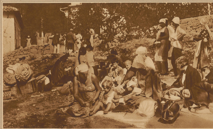
Am Morgen nach einer Schreckensnacht: Einwohner und Kurgäste aus zerstörten Häusern biwakieren im Freien