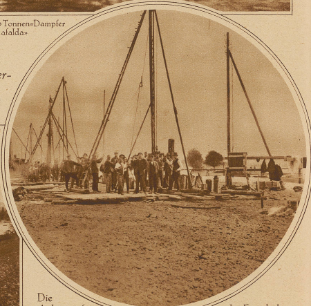
Die Arbeiten für den Wiederaufbau