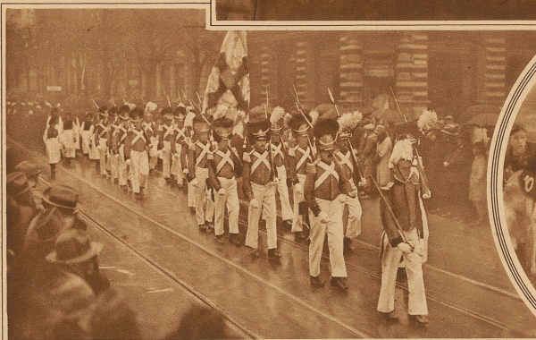
Grenadiere aus dem Lötschental