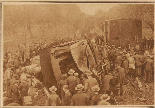
Auf der Langenthal-Huttwil-Bahn ereignete sich letzten Samstag ein Eisenbahnunglück, das schwere Folgen hätte haben können. Infolge eines Schienenbruches entgleiste bei der Ausfahrt aus der Station Madswil ein Güterzug. Die Lokomotive und die drei folgenden Wagen wurden umgeworfen. Wie durch ein Wunder blieben Führer und Heizer unverletzt und konnten aus der stark beschädigten Lokomotive hinauskrichen