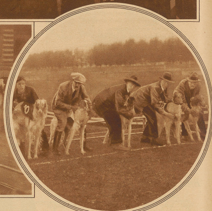
Flachrennen für Barsois. Am Start