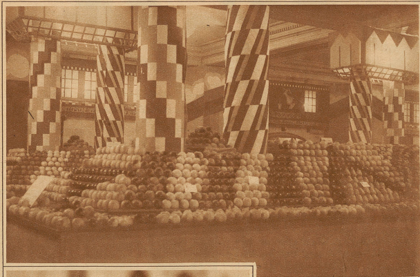
Die Obstausstellung Walliser Woche in Zürich Bild rechts: Kunstgewerbe