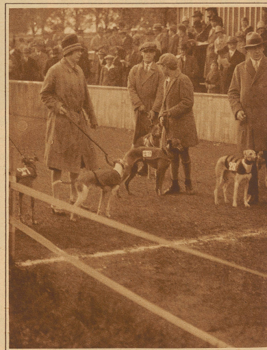
Whippets am Start