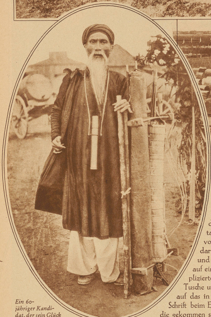
Ein 60-jähriger Kandidat, der sein Glück neuerdings versuchen will