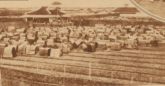
Blick auf einen Teil der Prüfungs-Zeltstadt von Nam-Dinh während des Examins

Die anderen können dann erst drei Jahre später wieder ihr Glück versuchen. So kommt es, daß einige 10- bis 15mal ins Examen steigen und in zwischen ein Alter von 50 bis 60 Jahren erreichen.