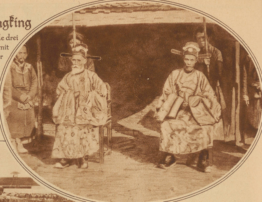
Prüfende Mandarine in ihrer zeremoniellen Tracht, von Dienern umgeben

Bild links: Anknüpf der Kandidaten mit ihrem Gepäck auf dem Examenplatz von Nam-Dinh