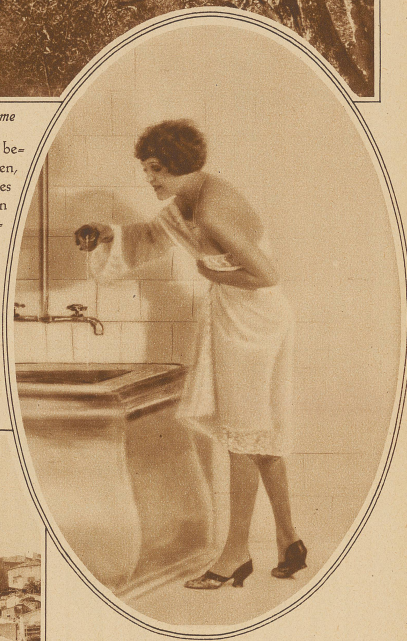
Einige Tropfen Parfüm erhöhen den Genuß des Dades

Orangenbäumen eingebettet liegt. In seinem Kern interessante geschichtliche Baudenkmäler bergend, stellt es als Ganzes mit seinen vielen Schloten eine Fabrikstadt dar, deren Nüchternheit aber durch die Ueppigkeit der Umgebung stark gemildert wird. Zudem hat Grasse den Vorzug eines Klimas, das es zu einer geschätzten Winter- und Sommerstation macht. Welcher Art die Industrie dieses Places ist, läßt sich schon aus meilenweiter Entfernung erraten. Wellen von Düften trägt uns der Wind entgegen. Welche Versuchung, einmal einen Blick in die Geheimküche dieser Luxusindustrie zu tun! Nichts ist leichter zu erfüllen als dieser Wunsch. Die Fabrikanten von Grasse, die sich mit Recht sagen, daß ihr Entgegenkommen gegenüber den Fremden gleichzeitig keine schlechte Reklame für ihre Erzeugnisse darstellen werde, öffnen gerne die Pforten ihrer Fabriken. Ja, an manchen Orten hat man sich