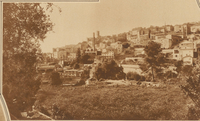
Grasse mit seinen unzähligen Parfümfabriken

Orangenbäumen eingebettet liegt. In seinem Kern interessante geschichtliche Baudenkmäler bergend, stellt es als Ganzes mit seinen vielen Schloten eine Fabrikstadt dar, deren Nüchternheit aber durch die Ueppigkeit der Umgebung stark gemildert wird. Zudem hat Grasse den Vorzug eines Klimas, das es zu einer geschätzten Winter- und Sommerstation macht. Welcher Art die Industrie dieses Places ist, läßt sich schon aus meilenweiter Entfernung erraten. Wellen von Düften trägt uns der Wind entgegen. Welche Versuchung, einmal einen Blick in die Geheimküche dieser Luxusindustrie zu tun! Nichts ist leichter zu erfüllen als dieser Wunsch. Die Fabrikanten von Grasse, die sich mit Recht sagen, daß ihr Entgegenkommen gegenüber den Fremden gleichzeitig keine schlechte Reklame für ihre Erzeugnisse darstellen werde, öffnen gerne die Pforten ihrer Fabriken. Ja, an manchen Orten hat man sich