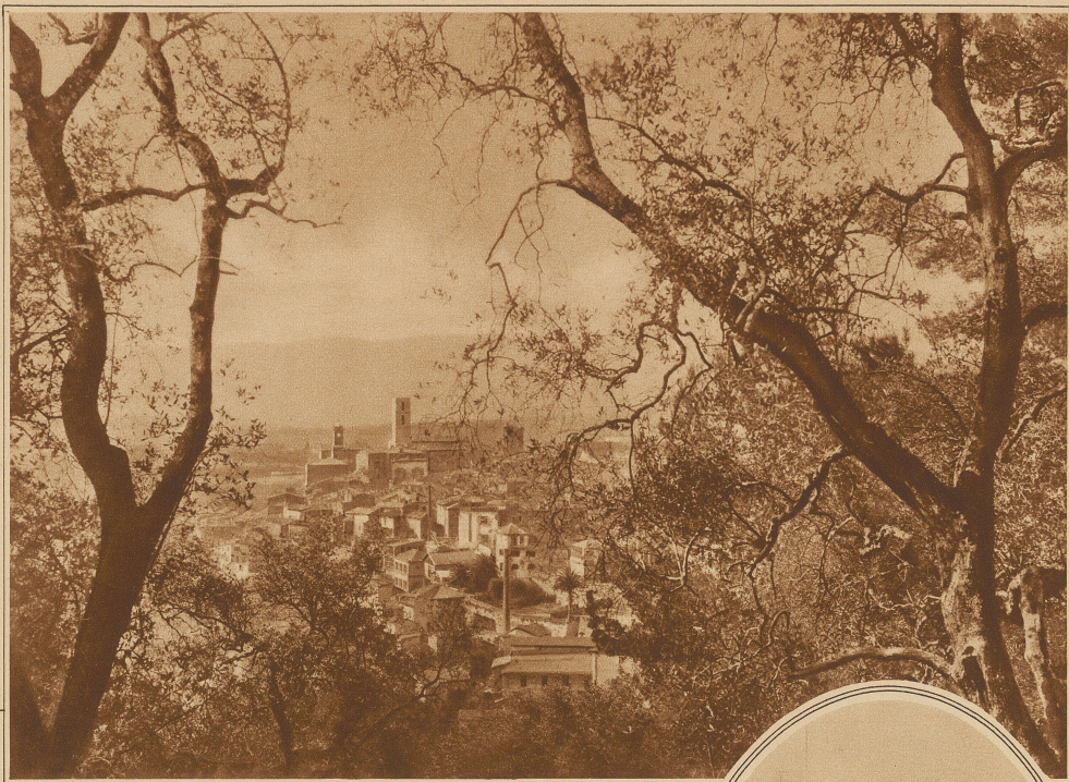
Grasse, im Durchblick durch Olivenbäume

Dennoch gewöhnt man sich an beides. Ich habe jahrelang in der Nähe einer Schokoladenfabrik mit ihrer süßlichen Atmosphäre gewohnt, ohne deshalb den Geschmack für das Erzeugnis zu verlieren. Und man kann in der Parfümstadt Grasse mit ihren ungefähr 50 Fabriken ganze Wolken von Duftgemischen einatmen, ohne daß einem deswegen die bewußte schöne Tischnachbarin zum Ueberdruß wird. Im Gegenteil: dieser Vorgeschmack von Cannes und Nizza auf dem Wege zur Côte d'Azur hat seinen eigenen Reiz, Vorgeschmack nicht nur im Sinne der Parfüms, denen wir unten in den eleganten Casinos in etwas weniger konzentrierter Form wieder begegnen, sondern auch im Landschaftlichen. Bildet doch Grasse gewissermaßen die Uebergangsstation auf dem Wege von der felsigen Einöde droben in den Seelpen zu der