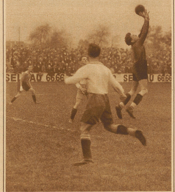
Beck fängt eine hohe Flanke Blue Stars-Winterthur 1:0