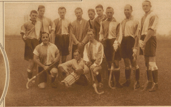
Die Grasshoppers-Hockeymannschaft, die das Spiel gegen Red Sox 3:0 gewann