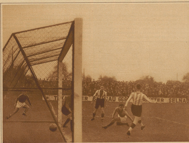
Das dritte Tor gegen Zürich