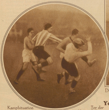
Kampfsituation vor dem