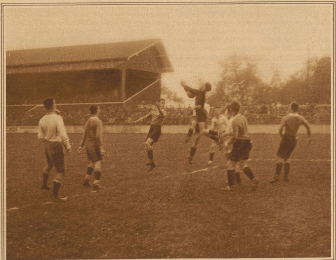
Eckball gegen Winterthur