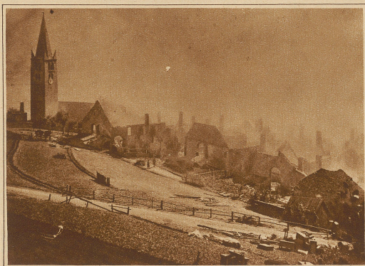
Eine gewaltige Feuersbrunst zerstörte das Dörfchen Puy St-André bei Briançon in den französischen Alpen. Dem in einer Epicorie entstandenen Brand fielen 80 Häuser zum Opfer