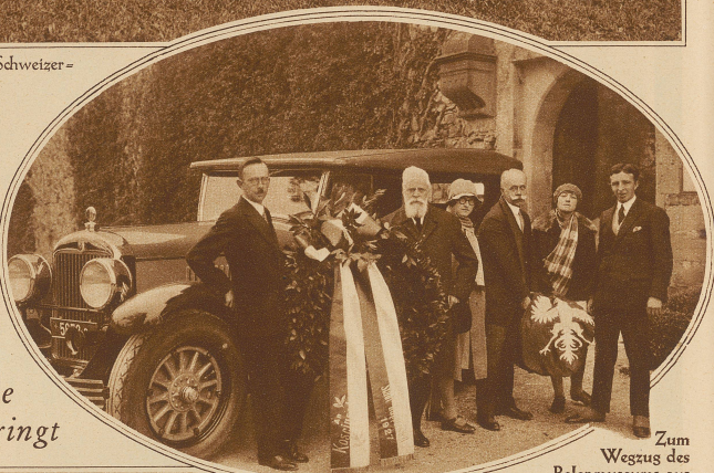
Zum Wegzug des