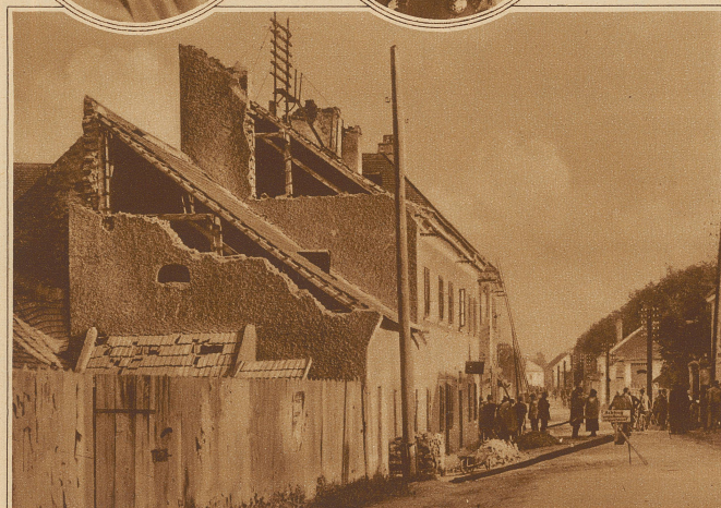
Straßenfront von verwüsteten Häusern in Schwadorf bei Wien