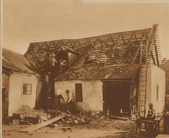
Einwohner eines Hauses in Schwadorf retten ihre Habe aus dem vom Erdbeben zerstörten Hause