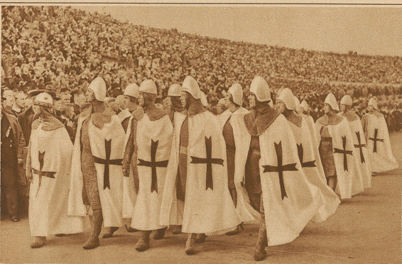
Vorbeimarsch einer Abteilung des Kyffhäuserbundes