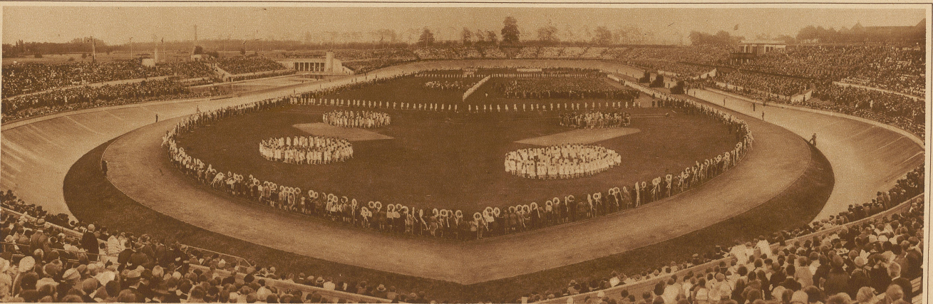
Aus der Geburtstagsfeier im Berliner Stadion. 40000 Berliner Schulkinder brachten Hindenburg ihre Huldigungen dar