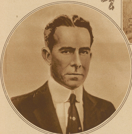
General einer der Führer der Aufständischen, wurde gefangen genommen und standrechtlich erschossen