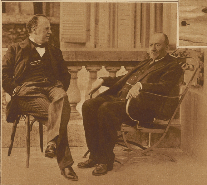
Zur Affaire Rakowski. Tschitscherin, der sowjetrussische Außenminister (rechts) und Botschafter Rakowski im Gespräch über die von Frankreich verlangte Abberufung

Aus dem Autorennen um den Großen Preis von England, der von Benoist gewonnen wurde. Das Bild zeigt eine der Kurven der Brooklands Rennbahn, in welche Sandbänke eingebaut wurden, um das Rennen zu erschweren und allzu große Geschwindigkeiten zu verhindern