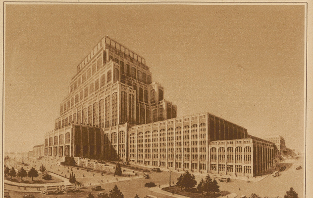
Ein Riesenprojekt für einen neuen Zentral-Bahnhof in Berlin. Der Bahnhof würde der größte der Welt sein und ein großes Hotel und riesige Büroräume enthalten. Im 50. und 55. Stockwerk ist eine Promenade mit Verkaufsläden vorgesehen. Variété und Kinos dürfen natürlich nicht fehlen. Rings um die Lichthöfe sollen Ausstellungen- u. Messehallen eingebaut werden. In 150 m Höhe würde das Dachrestaurant zu liegen kommen