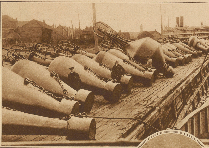
Gewaltige schwimmende Leuchtbojen, die den Kurs auf dem St. Lawrencefluß anzeigen. Diese Bojen werden zur Winterzeit heraufgezogen und zu Beginn der Schifffahrt wieder versenkt

maßen, sind deswegen beliebt, weil sie auch im Nebel warnen. In Amerika werden besonders Leuchtbojen bevorzugt, die mit einer komprimierten Gasfüllung ausgerüstet sind, die zirka vier Wochen brennt. Die Inbetriebhaltung dieser Leuchtbojen erfordert besondere Patrouillenschiffe, welche die Bojen einholen und durch neue ersetzen. Durch Verankerung wird der Platz der Boje genau bestimmt und in die Seekarte zur Orientierung eingetragen. « Eine besondere Schwierigkeit ergibt sich daraus, daß die Bojen in Meeresteilen, die unter Treibeis oder Eispackungen leiden, häufig von der Verankerung losgerissen oder beschädigt werden und versinken. Diese Tatsache würde ohne dauernde Kontrolle eine starke Beeinträchtigung der Sicherheit der Fahrzeuge hervorrufen. Aus allen diesen Gründen ergibt sich die Notwendigkeit einer dauernden genauen Kontrolle und Festlegung der Bojen in Übereinstimmung mit den in der Seekarte eingetragenen