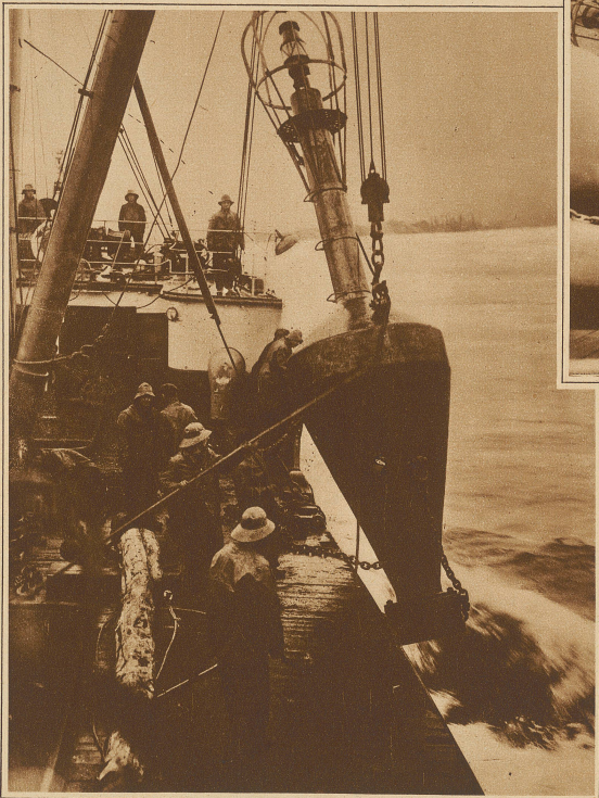
Interessante Aufnahme eines bojenlegenden Schiffes der kanadischen Regierung im Augenblick des Abwerfens einer der ungeheuren Leuchtbojen des St. Lawrenceflusses

Eines der interessantesten Kapitel aus dem Gebiete der Sicherung des Seeschiffahrtsweges ist die Markierung der Wasserstraßen durch Bojen, Tonnen und Baken. Die verschiedensten Konstruktionen sind zu diesem Zwecke im Gebrauch. Unsere Bilder zeigen den Betrieb und die Unterhaltung von Tonnen, die mit Beleuchtung ausgestattet sind, sogenannte Leuchtbojen. « In Deutschland ist es üblich, auf der Steuerbordsseite, vom heimkehrenden Schiff aus gesehen, die Schifffahrtslinie zu markieren. Heulbojen, die den Wind für eine Sirene aus-