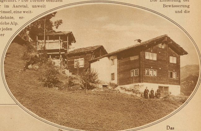
Das Törbler Heimwesen: Wohnhaus, Stall und Speicher hintereinander

Bekanntermaßen werden alle Walliser Bergdörfer von einem mühevoll angelegten Bewässerungssystem durchzogen. So auch Törbel. Leider besitzt es keine Gletscherbäche, wie z. B. das gegenüberliegende Grächen. Es gehört daher zu den trockensten Orten im Wallis. Hat der erste Sonnenstrahl im Osten das Fletschhorn vergoldet, fällt er gleich nachher aufs