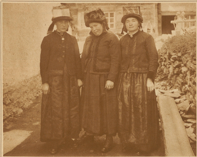
Törblerinnen im Sonntagskleid

Dörfchen Törbel, und durchglüht es, bis abends spät die feurige Kugel im Westen verschwindet. Die Einteilung der Bewässerung und die