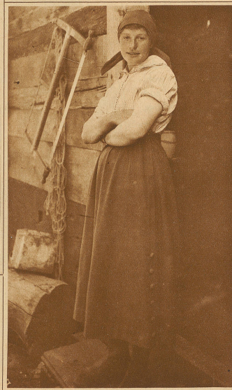
Die Heiratslustige im Dorfe

Benützung des Wassers geschieht nicht nach dem Stand der Uhr, sondern nach dem Stand der Sonne, beziehungsweise des Schattens. Man hört ab und zu den Satz: Die Walliser Bergbauern sind faul und bequem. Das ist ein ungerichteter Vorwurf. Wer die steilen und mühsam zu bearbeitenden Bodenflächen betrachtet, der wird das Ausruhen des Höhenbewohners leicht begreifen.