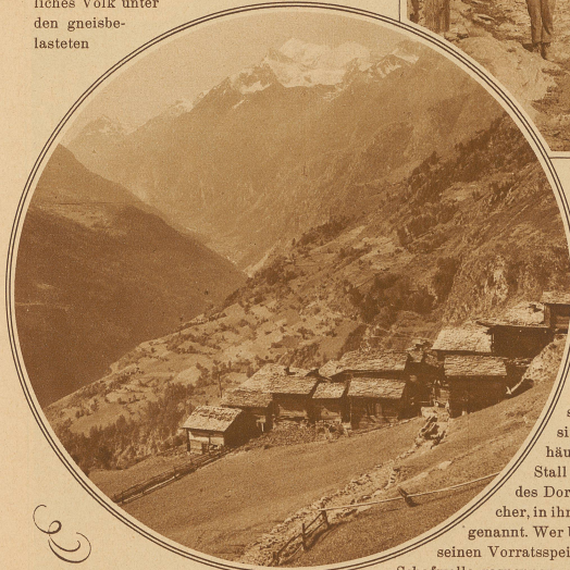
Dorfpartie mit Blick auf die Weißhorngruppe

Benützung des Wassers geschieht nicht nach dem Stand der Uhr, sondern nach dem Stand der Sonne, beziehungsweise des Schattens. Man hört ab und zu den Satz: Die Walliser Bergbauern sind faul und bequem. Das ist ein ungerichteter Vorwurf. Wer die steilen und mühsam zu bearbeitenden Bodenflächen betrachtet, der wird das Ausruhen des Höhenbewohners leicht begreifen.