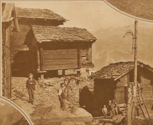
Die Speicher werden über die bekannten Gneisplatten gebaut, zum Schutze gegen Ratten und Mäuse

Ein solch einsames Bergdorf zum Ausruhen ist Törbel. Weltfern und sonndurchglüht, liegt es hoch über dem Vispertal. Von Stalden gelangt man in 2 Stunden auf gutgepflegtem Bergpfade, oder noch besser auf dem Rücken eines Maultieres nach der 600köpfigen Siedlungsinsel. Wie Besenwurf scheinen seine dunkelbraunen Häuschen in die blumigen Bergwiesen hineingeworfen. Dem Wanderer winkt da oben kein einziges Wirtshauschild entgegen, keine einzige Pinte ladet Gäste ein. Dafür wohnt ein gastfreundliches Volk unter den gneisbelasteten