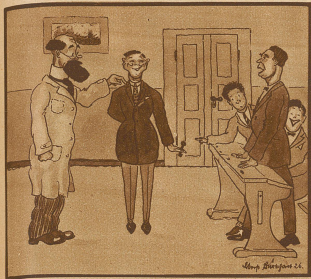
«Wie heißt dieser Knochen hier, Müller?» «Dieser heißt ..... das ist der .....» (sieht den ihm vorgehaltenen Schlüssel) «Das ist der Haisknochen, Herr Professor!»

Berichtigt. Der Mattenschneider hatte dem Gränschneider ein neues Gewand gemacht, vom gelieferten Halblein aber, wie üblich, einen gehörigen Fetzen unterschlagen. Der Sepp kam indessen dem Schneider auf den Sprung und rüffelte ihm mit der entrüsteten Frage, ob er sich denn nicht ein Gewissen daraus mache. Verblüfft erwiderte der Mattenschneider: «Nei, das nit, aber es git de öppe-n-es Schlee!»