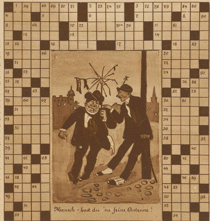
Hensch - hast du 'ne feine Entzeme!

rieken am Zürichersee; 86. Die Hälfte von einem Reer; 87. Ein halber französ. Garten; 88. Promenade; 89. Der kleine Eduard; 90. Vereinigung; 91. Gewürz; 92. Russisch. Bildnis- und Historienmaler; 93. Französ. Vereinung.