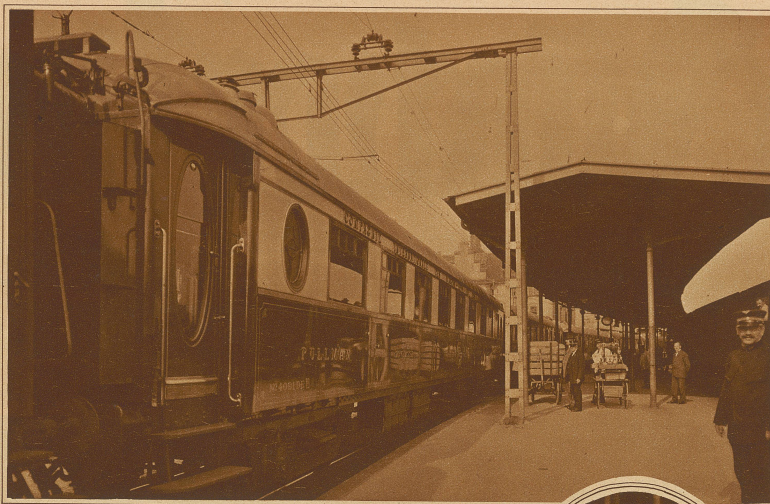
Der Gotthard-Pullman-Express bei seiner Ausfahrt aus der Station Arth-Goldau, wo die beiden Züge von Basel und Zürich zusammengelegt wurden

Der erste Pullman-Zug der Schweiz. Seit Donnerstag verkehrt auf den Strecken Basel- und Zürich-Mailand und zurück ein neuer Luxuszug, der nur aus Pullman-Wagen 1. und 2. Wagenklasse zusammengesetzt ist. Die Fahrzeit beträgt, einschließlich der Auenthalte für die 372 km lange Strecke Basel-Mailand, nur 6 Std. 40 Min. Dem Reisenden ist also neben allem Komfort auch eine außerordentl. rasche Verbindung zwischen den großen Zentren geboten.