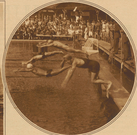
Start zum 400 m-Schwimmen freier Stil