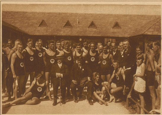
Deutschlands siegreiche Mannschaft