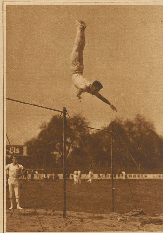
Giudici, Locarno, Fleurier am Reck