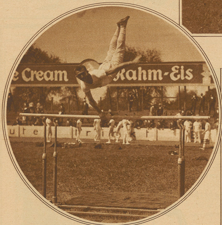
Wilhelm, Bern. Kreisflanke über beide Holme