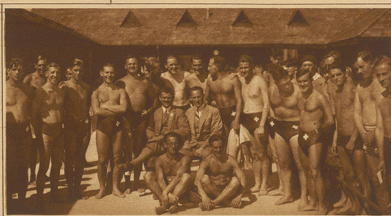
Die Schweiz, Nationalmannschaft