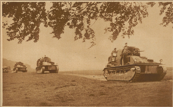
Die neuesten großen Tanks der englischen Armee anlässlich einer leichten Woche durchgeführten Übungsfahrt