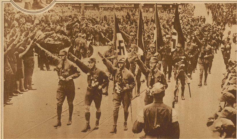
Uniformierte Nationalsozialisten durchziehen die Straßen Nürnbergs mit ihren Bannern. Der Fascistengruß scheint auch in Deutschland Schule zu machen