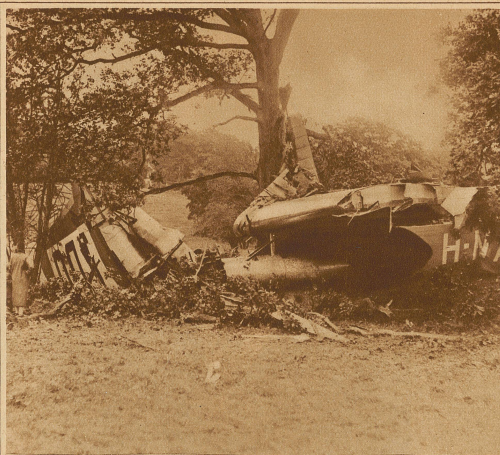
Die Trümmer eines englischen Verkehrsflugzeuges, das mit 8 Passagieren bei Sevenoaks abstürzte. Der Mechaniker wurde dabei getötet, während der Pilot und die Passagiere mit leichten Verletzungen davonkamen