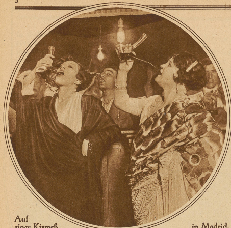
Auf einer Kirmes in Madrid. Schöne Spanierinnen trinken Wein aus eigenartig geformten Gefäßen