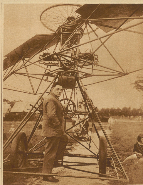
Engelbert Zaschka, ein deutscher Ingenieur, hat ein Hubschrauberflugzeug konstruiert, das horizontal sein soll, vertikal aufsteigen, in der Luft stillstehen und wieder senkrecht zu landen. Wichtig ist ferner, daß es dem Erfinder geglückt zu sein scheint, in der Luft völlige Stabilität und auch ein Gleitvermögen des Flugzeuges zu erreichen. Unser Bild zeigt Ing. Zaschka mit seinem Apparat auf dem Fluggelände Johannisthal