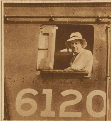
Englands Ministerpräsident Baldwin als «Lokomotivführer» bei einer Probefahrt der größten englischen Lokomotive in Kanada