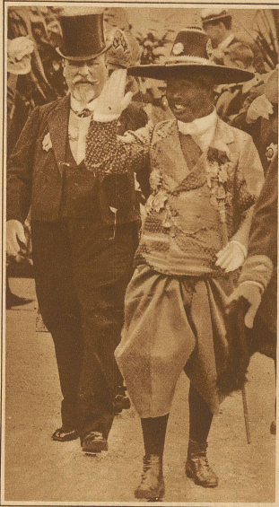
König Sisowath von Cambodja ist im Alter von 87 Jahren gestorben