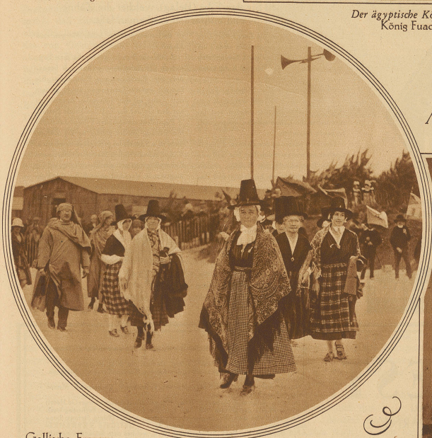
Gallische Frauen in ihren Nationalkostümen anlässlich eines keltischen Festes in der Bretagne