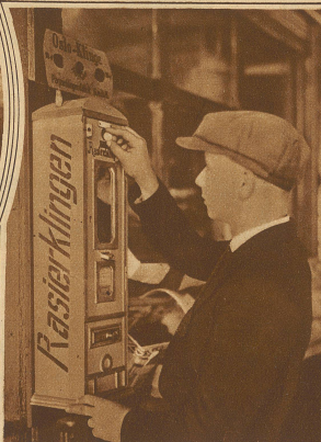
Ein Automat für Rasierklingen ist das Neueste, das gegenwärtig in Berlin zu sehen ist. Ob dieser bartlose Jüngling wirklich schon solche Klingen braucht . . . ?