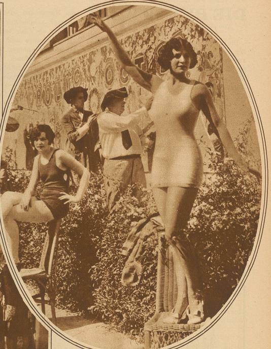
Bekannte Maler Californiens bemalen die Wände der Ausstellungsgebäude der im Oktober stattfindenden Kunstausstellung in Los Angeles mit Bildern schöner Californierinnen, die sich als Modelle auf offener Straße aufstellen