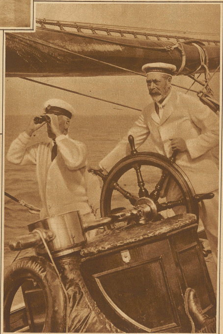
Der König von England am Steuer seiner Yacht «Britannia»