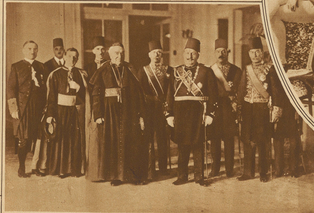
Der ägyptische König beim Papst. Kardinal Gasparri führt König Fuad und seine Begleiter zum Empfang