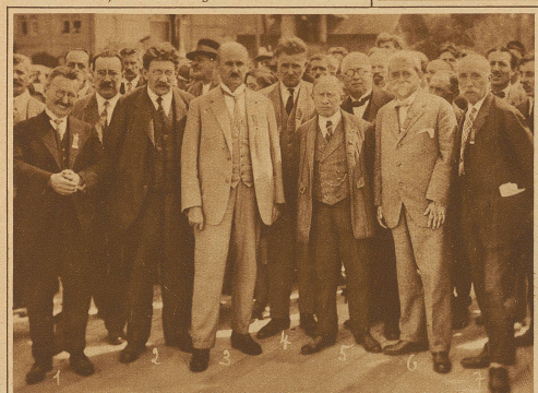
Die führenden Köpfe an der Tagung der soz. «Bodensee-Internationale» in Arbon. 1. Reichstagspräsident Lobe, Berlin; 2. Dr. Adler, Wien; 3. Nationalrat Huber, St. Gallen; 4. Armuzzi, Zürich; 5. Bundesrat Ellenbogen, Wien; 6. Bundesrat Winter, Wien; und 7. Nationalrat Domes, Wien.