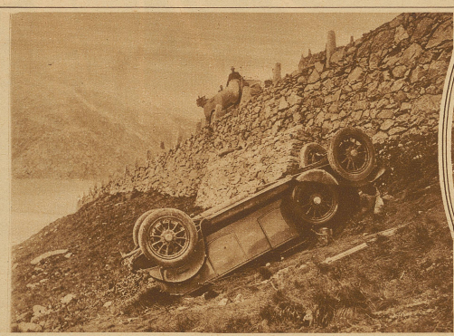
Auf der Furkastraße oberhalb des Hotels Belvedere ereignete sich letzten Montagvormittag ein schweres Automobilunglück. Ein Automobil aus Mülhausen im Elsaß stürzte über den Straßenrand hinaus und überschlug sich. Zwei Damen fanden dabei den Tod, während die beiden übrigen Insassen mit dem Schrecken davonkamen. Unser Bild zeigt das abgestürzte Auto.