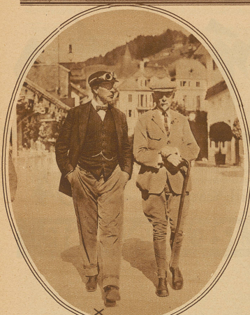
Der König von Belgien, der Engelberg auf seinem Motorrad einen Besuch abgestattet hat, auf einem Gang durchs Dorf.