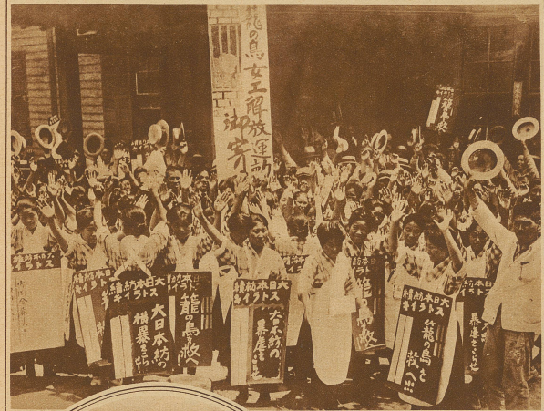
Wie ein Streik in Japan aussieht. Demonstration japanischer Arbeiterinnen und Arbeiter einer Baumwollfabrik