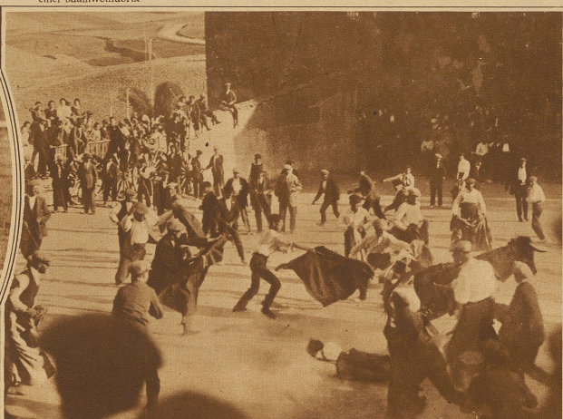
In der kleinen Stadt Cobena (Spanien) finden die Stierkämpfe nicht in einer Arena, sondern, wie unser Bild zeigt, auf öffentlicher Straße statt