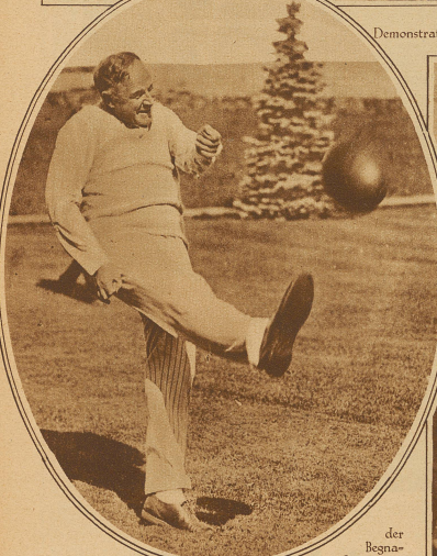
Alvan T. Fuller, der Gouverneur d. Staates Massachusetts, dessen Ablehnung der Begnadigung von Sacco und Vanzetti großes Aufsehen erregte, amüsiert sich beim Fußballspiel