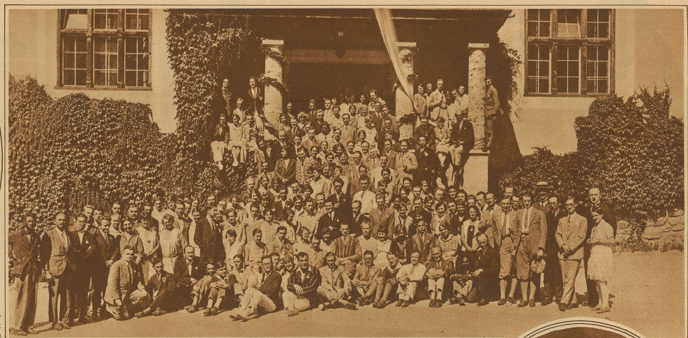
Die Teilnehmer am Weltstudenten-Kongress in Schiers.