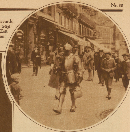
Bild rechts: Originelle Straßenreklame auf den Pariser Boulevards. Der in eine echte mittelalterliche Rüstung gekleidete Mann trägt eine Damenledertasche in der Hand, die er von Zeit zu Zeit erhebt, um die Passanten auf die Verkaufsfirma aufmerksam zu machen