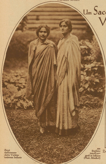
Zwei weibliche Vertreterinnen Indiens

Dieser Kriminalfall von ungeheurem Ausmaß beschäftigt die Gemüter nun schon mehr als sechs Jahre und immer lauter werden die Zweifel an der Stichhaltigkeit der zusammengetragenen Indizienbeweise, die zur Verhängung des Todesurteils über die beiden führten. Ob sie schuldig sind, läßt sich aus der Ferne nicht beurteilen. Aber soviel scheint festzustehen, daß der ganze Fall nicht einwandfrei abgeklärt ist. Schon aus diesem Grunde wäre eine Begnadigung, die überdies einem Gebote der Menschlichkeit entspräche, gerechtfertigt