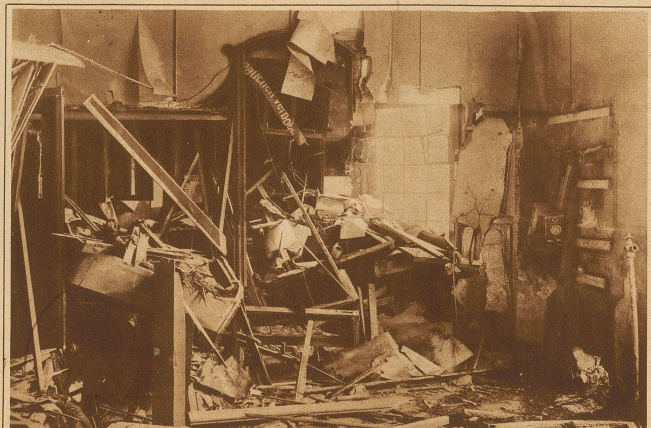
Das Bombenattentat in Basel. Blick ins Innere des demolierten Tramhäuschens nach der Explosion der Bombe, die in der Telefonkabine (rechts im Bilde) niedergelegt wurde