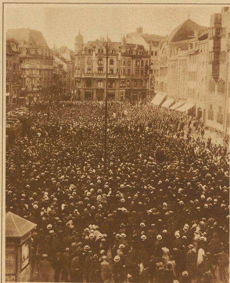
Die Demonstrationsversammlung auf dem Marktplatz in Basel während des einstündigen Proteststreiks