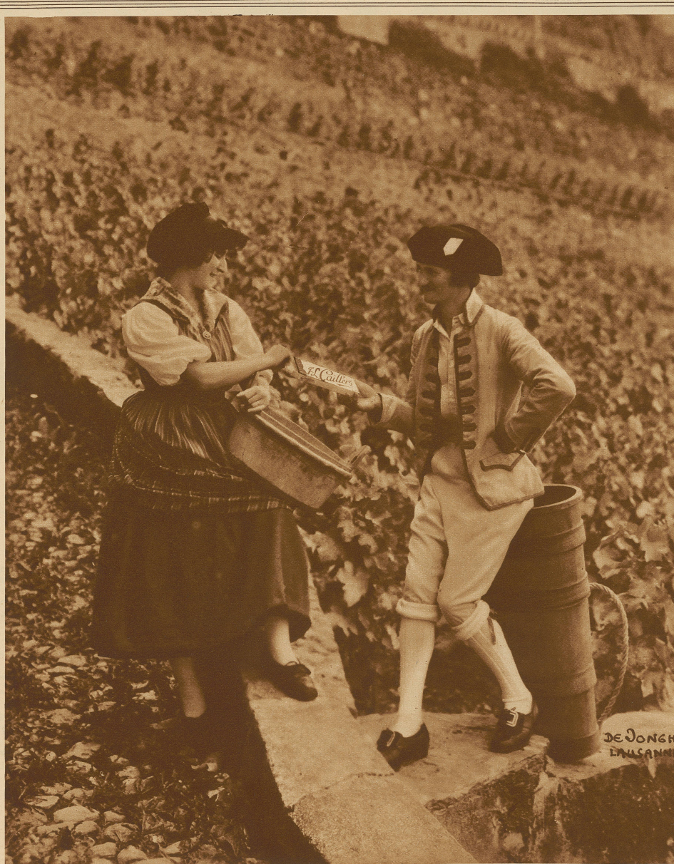
Das Wingerfest in Beven 1927 und die Milch-Chocolate Cailler

Was der Rost dem Eisen, das ist der Neid dem Menschen