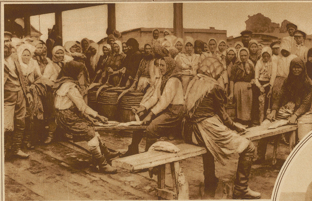
Reinigen und Ausweiden

In Rußland bewegte sich daher in den Zeiten vor dem Kriege und der Revolution der Preis dieses köstlichen und wegen seiner Hauptbestandteile, Eiweiß und Fett, sehr nahrhaften Genußmittels auf einer Stufe, die ihn zum Volksmittel werden ließ.