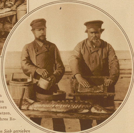
Rechts: Der Roge wird durch ein Sieb getrieben

Die Störfischerei lohnt ihren Mann, wenn das Glück günstig ist. So ein Haufen von 30 Zentnern birgt an 500 Pfund Rogen, die einen sehr beträchtlichen Wert darstellen. Welche Bedeutung die Kaviargewinnung im Volkshaushalt der Ufer- und Küstenbewohner der großen Ströme und Seen besitzt, zeigt der Wert der jährlichen Ausfuhr, der in Friedenszeiten zwei bis drei Millionen Rubel betrug. Neben dem hellgrauen, großkörnigen, milde gesalzenen, Malosol genannten und sehr wertvollen Kaviar, der auch in Rußland für die breite Menge des Volkes zu teuer ist, spielt der sogenannte Preßkaviar als gewöhnliches Volksmittel eine bedeutende Rolle. Der schwarzgraue und feinkörnige Elbkaviar, auch deutscher oder Hamburger Kaviar genannt, wird von den Stören der Nord- und Ostsee und der Unterelbe gewonnen. Mit dem Namen «Roter Kaviar» bezeichnet man eine Sorte, die in Rußland und Schweden aus dem Rogen anderer Fischarten, so dem Karpfen, Zander, Hechte, bereitet wird.