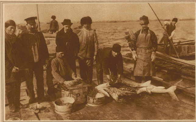
Bearbeitung eines gefangenen Störs