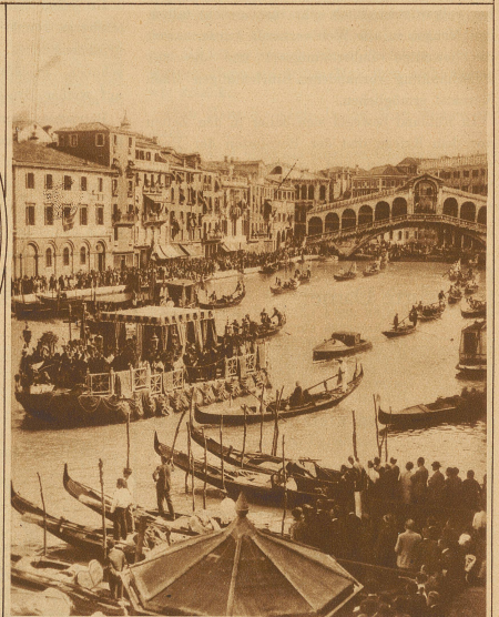
Bild rechts: Die Ueberführung eines Reliquats des Heiligen Franz von Assisi nach Venedig wurde mit großen Zeremonien gefeiert. Unser Bild zeigt den imposanten Anblick der Gondel mit der Reliquie auf dem Canale Grande, im Hintergrunde die berühmte Rialto-Brücke