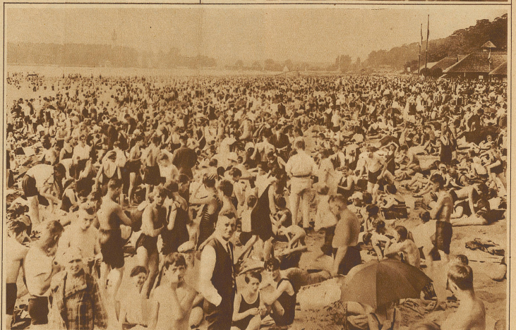
70000 Menschen baden an einem Sonntag im Bad Wannsee bei Berlin