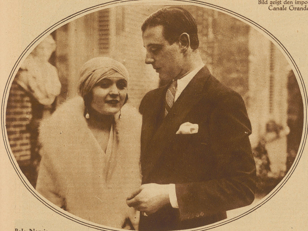
Pola Negri Prinz unecht?? Eine recht unangenehme Eheenttäu- schung soll die Filmschauspielerin Pola Negri, die sich kürzlich mit dem Prinzen Sergei Mdivani verheiratet hat, erlebt haben.