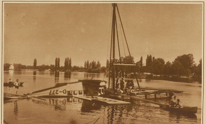
Letzten Samstag stürzte ein in Konstanz; stationiertes Wasserflugzeug mit 4 Personen in den Rhein. Passagiere und Pilot kamen heil davon, dagegen wurde der Apparat stark beschädigt