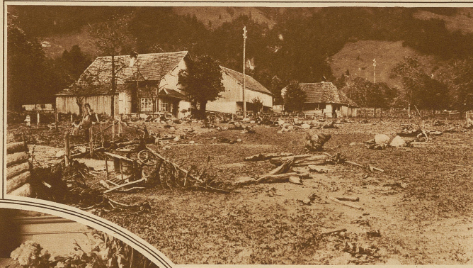
Verwüstungen bei Blumenstein