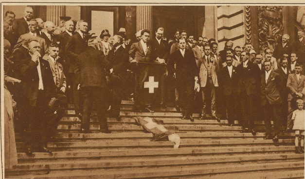
Zum lächtathletischen Länderwettkampf Deutschland-Schweiz in Düsseldorf. Der offizielle Empfang der Schweizer durch die Behörden