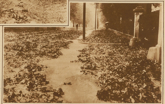
Auf der vom Hagel mit Laub und Wasser überschwemmten Allmendstraße in Thun

konnte dieser Tage sein 40. Dienstjubiläum feiern