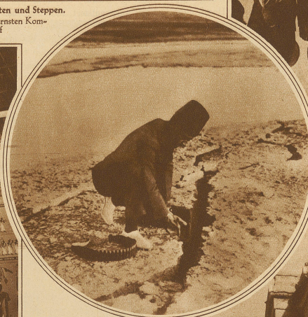
Während des Erdbebens entstanden längs des Jordans kilometerlange Risse im Boden