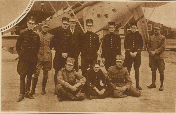
Die holländische Equipe für das Zürcher Flugmeeting

bracht. Hier machte man zunächst die Feststellung, daß die Verunglückte überhaupt kein Krüppel war, sondern daß die Entsetzen erregenden Prothesen am Körper der Bettlerin geschickt angebracht waren, um die beabsichtigte Täuschung hervorzurufen. Im Laufe der Untersuchung kam man weiter dahinter, daß sich die Bettlerin nach vollbrachter Tages-Arbeit in eine Dame von Welt verwandelte, die in den vornehmsten Restaurants zu speisen und in einer Loge des Theaters Platz zu nehmen pflegte. Ihr Handwerk hatte sich gelohnt, denn sie verfügte über ein Bankkonto von 50,000 Lire.