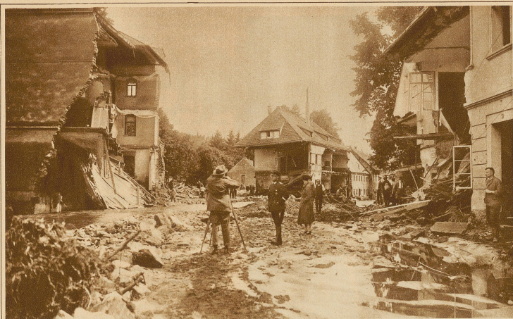
Die Verwüstungen in einer Straße von Bergschönbühl