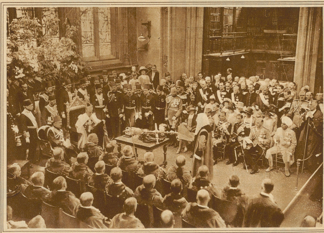
Der Empfang des Königs Fuad von Aegypten durch den Lord Mayor von London in der Bibliothek der Guildhall