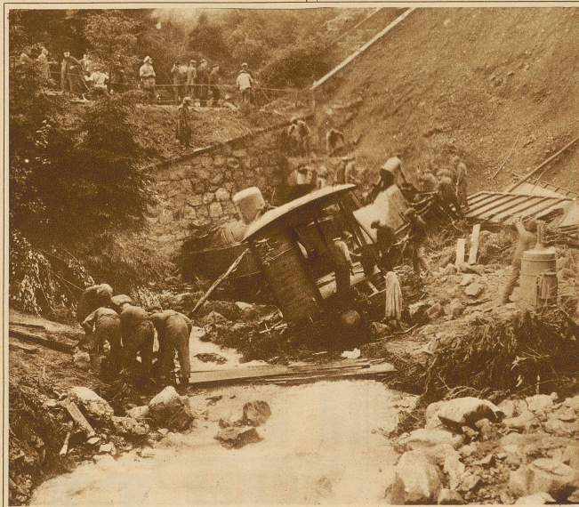
Schweres Zugunglück im Harz. Infolge eines starken Gewitterregens geriet der vom Wasser unterspülte Bahndamm bei Wernigerode ins Rutschen, so daß der in diesem Moment darüber fahrende Personenzug in die Tiefe stürzte. 6 Personen fanden dabei den Tod