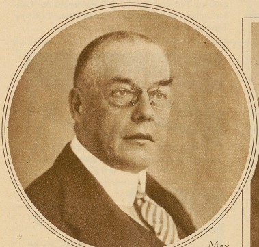
General Max Hoffmann, der im Weltkrieg auf dem russischen Kriegsschauplatz eine führende Rolle spielte und hauptsächlich als Friedensunterhändler von Brest Litowsk bekannt wurde, ist 88-jährig gestorben

Ein Unwetter von beispielloser Gewalt ging in der Nacht des letzten Sonnabends über das westliche Erzgebirge nieder. Die Fluten stiegen in einzelnen Dörfern in wenigen Minuten an die Hausdächer, so daß viele Einwohner in ihre Wohnungen eingeschlossen wurden und ertranken. Am meisten hat das Dörfchen Bergschönbühl gelitten, das allein 92 Tote zu beklagen hat. Noch immer werden Personen vermißt. Die Gesamtzahl der Todesopfer wird mit 180 angegeben