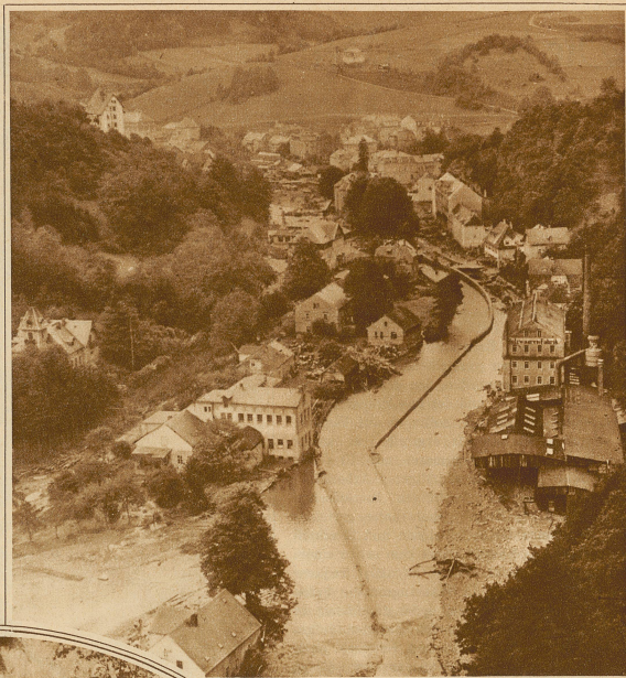
Blick auf den oberen Teil des Dörfchens Bergschönbühl nach der Katastrophe. Die Wassermassen zwängten sich haushoch durch das enge Tal und zerstörten im unteren Dorfteile 17 Häuser