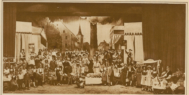
Marktszene aus dem Festspiel des aargauischen Kantonschützenfestes in Reinach