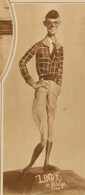
Eine groteske Wachsfigur vom Ozeanflieger Lindbergh