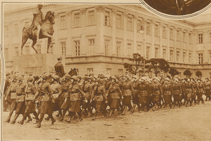
Kriegerische Jugend in Polen. Dieser Tage fand in Warschau eine Parade der Schülerinnen statt, die sich für den militärischen Hilfsdienst hinter der Front im Kriegsfall vorbereiten