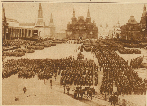
Heerschau der Roten Armee. Truppenparade auf dem Roten Platz in Moskau