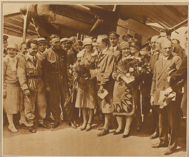
Chamberlin und Levine, die beiden kühnen Ozeanflieger, reisten nach Bremen, um ihre zu Schiff angekommenen Frauen in Empfang zu nehmen. Levine hatte seiner Frau bekanntlich die Absicht, sich am Fluge zu beteiligen, verheimlicht, so daß sie erst durch die Zeitungen von seiner «Flucht» erfuhr. Das Wiedersehen soll aber deshalb nicht minder herzlich gewesen sein