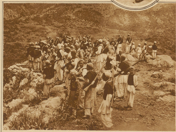
Albanische Freischärler der Provinz Mirdita halten an der jugoslawischen Grenze Wacht