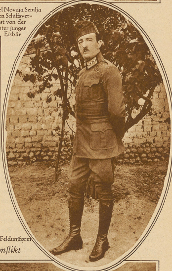
Rechts: Achmed Zogu, der Präsident Albaniens, in Felduniform Zum albanisch-jugoslawischen Konflikt