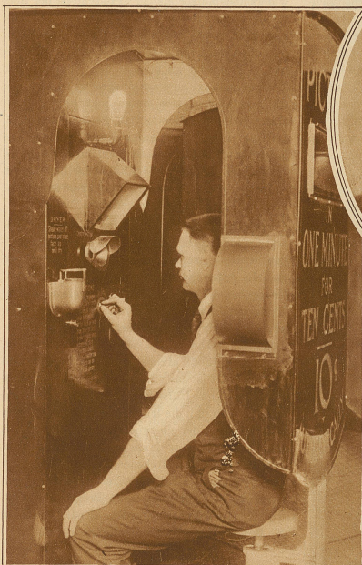
Eine neue amerikanische Erfindung: eine automatische Photographiermaschine, die für so Rappen jeden Passanten photographiert und innerhalb einer Minute ein eingerahmtes Bild hervorbringt. Dem Erfinder sind für das Patent über 10 Millionen Franken geboten worden, doch hat er den Betrag ausgeschlagen, da er offenbar nicht mit Unrecht der Meinung ist, daß er durch die Selbstfabrikation der Apparate erheblich mehr verdienen könne