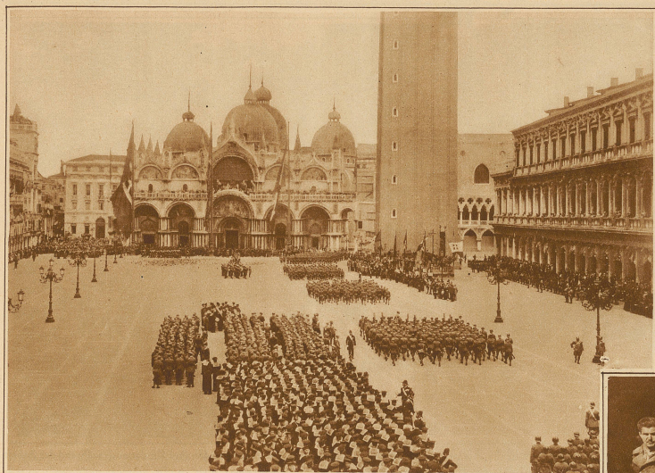
Anlaßlich der Verfassungsfeier fanden in ganz Italien große Truppenrevuen statt. Unser Bild zeigt den Aufmarsch auf dem Markusplatz in Venedig