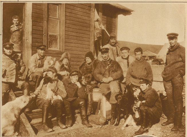
Die nördlichste Radiostation der Erde befindet sich auf der Insel Novaja Semlja im nördl. Eismeer und dient vor allem zur Regelung des dortigen Schiffsverkehrs. Die Bedienungsmannschaft, die alljährl. abgelöst wird, ist von der Außenwelt fast völlig abgeschlossen. Links im Bilde ein gezähmter junger Eisbär