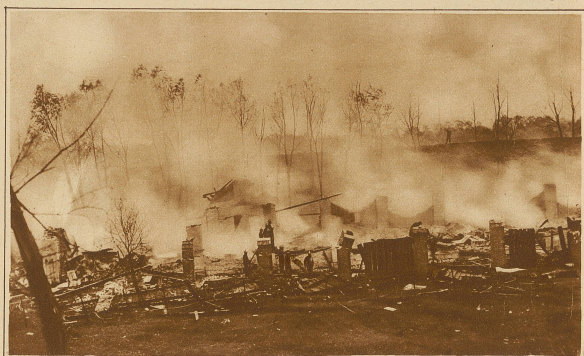
Eine große Explosionskatastrophe zerstörte am 7. Juni die Futterlei in Wisłowa bei Krakau. Durch die Explosion wurden mehrere Häuser der Umgebung zerstört und über 400 Personen verletzt