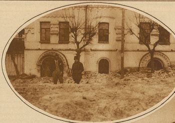
Die Rundbogen-Eingänge zum Keller, in welchem die Zarenfamilie erschossen wurde

Bisher mußte bei längeren Fahrten eines Luftschiffes, wenn der mitgeführte Vorrat an flüssigen Brennstoffes allmählich geringer wurde, die dadurch hervorgerufene Verminderung des Luftschiffgewichtes durch Ablassen einer entsprechenden Menge von Wasserstoffgas ausgeglichen werden, um nicht durch zu starkes dy-