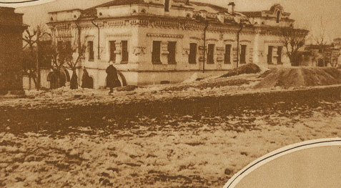
Das Schloß, der Verbannungsort der Zarenfamilie

Von einem soeben aus Rußland zurückgekehrten gelegentlichen Mitarbeiter sind uns drei Aufnahmen von Jekaterinburg zur Verfügung gestellt worden, das seinerzeit durch die Ermordung der russischen Zarenfamilie zu trauriger Berühmtheit gelangte. Bekanntlich war damals Wjolkow, der vorige Woche in Warschau der Kugel eines russischen Studenten zum Opfer fiel, eines der einflußreichsten Mitglieder des lokalen Sowjets von Jekaterinburg und wohl auch der eigentliche Urheber des Schreckenstat