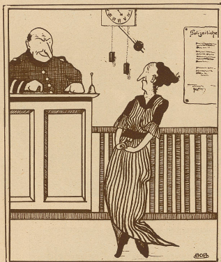
Untersuchungsrichter zur Frau eines steckbrieflich Verfolgten: «Hät' erc Ma kä bsondrigi Kennzeiche? Woll - woll! Er häd en Bandwurm.»

Ungalant. «Findest du diesen Hut nicht auch vorteilhafter als den anderen, Emil?» «Ja, ich meine auch, man sieht weniger von deinem Gesicht!»